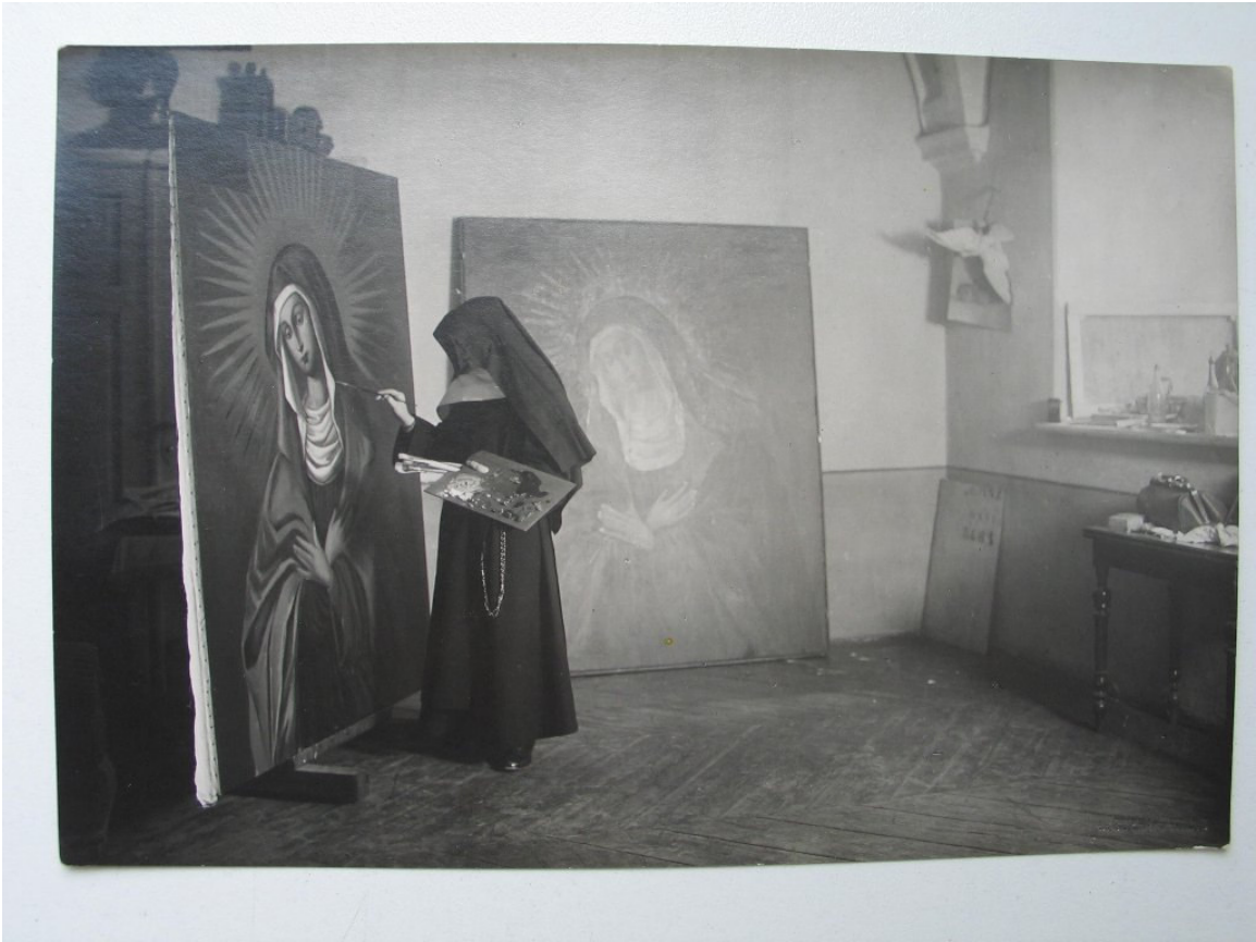
Siostra Franciszka ze zgromadzenia SS. Bernardynek przy kopiowaniu obrazu w 1927 roku M.B. Ostrobramskiej.