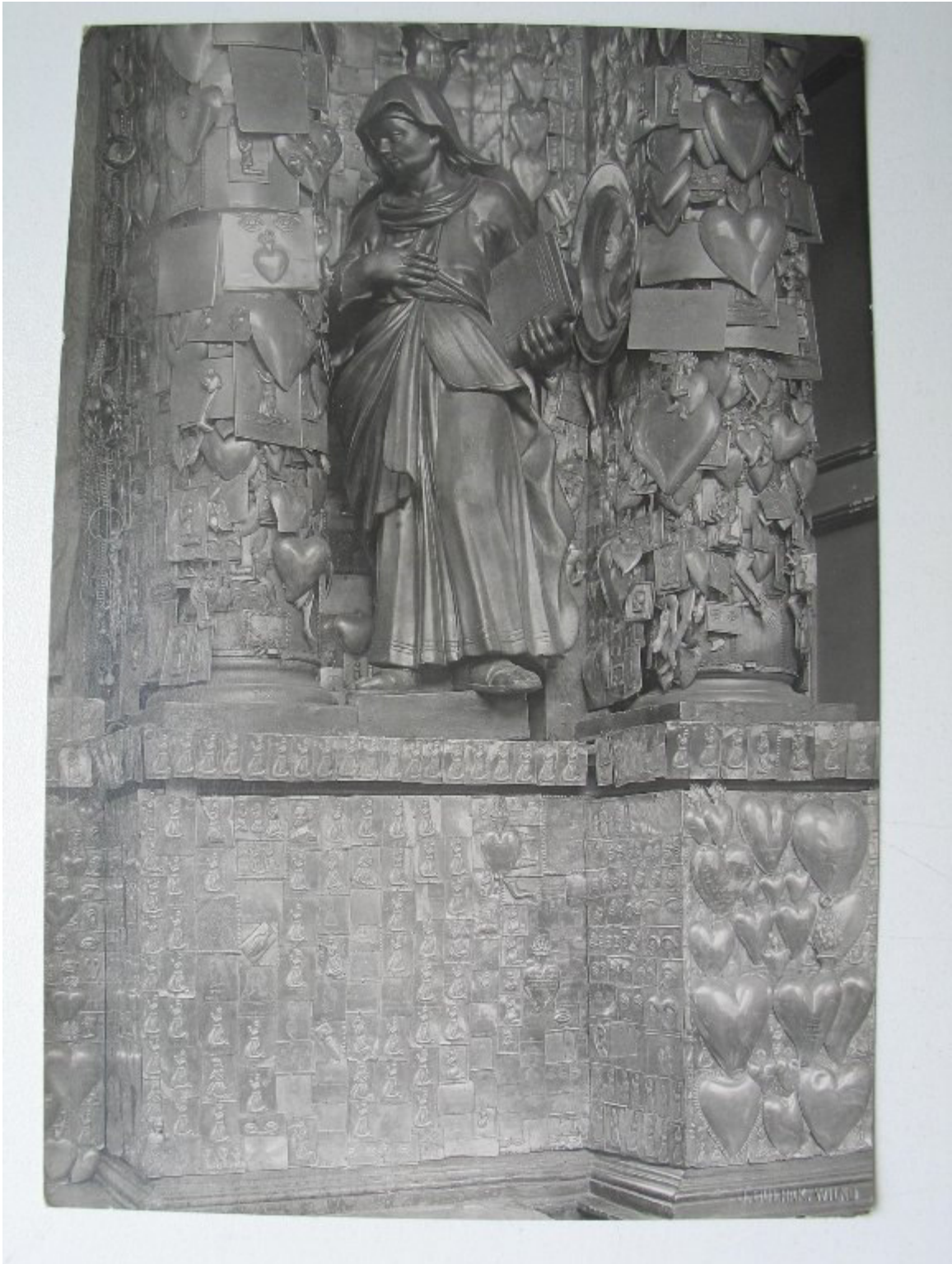
Kaplica ostrobramska. Figura w ołtarzu i wota.