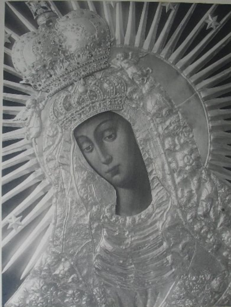
M.B. Ostrobratka w szacie. Fragment.