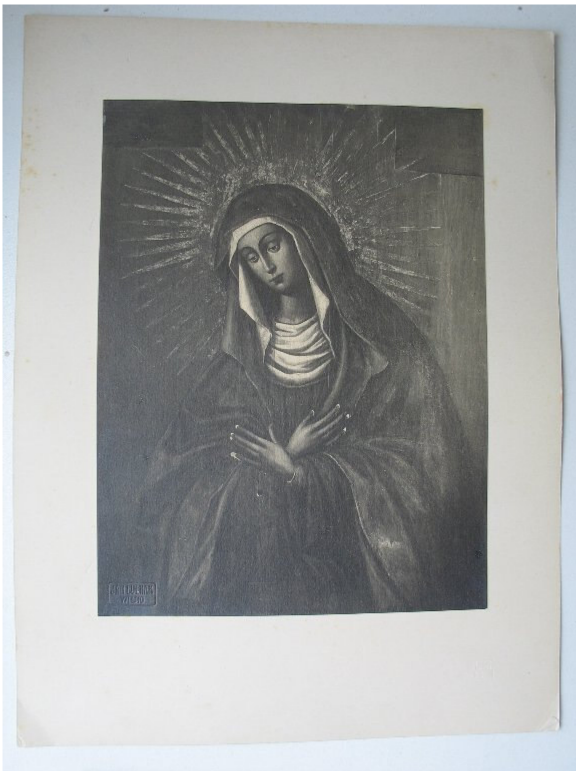
Obraz M.B. Ostrobramskiej po konserwacji.