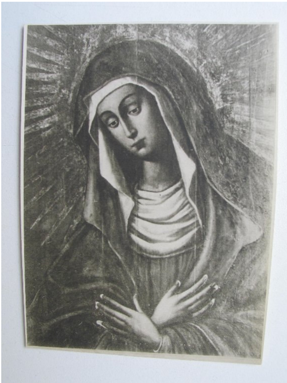
Matka Boska Ostrobramska