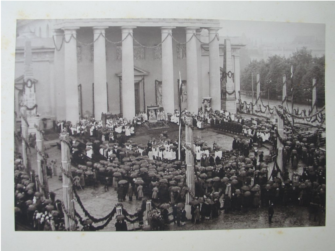
Koronacja obrazu M.B. Ostrobramskiej 2 lipca 1927 roku przed katedrą wileńską.