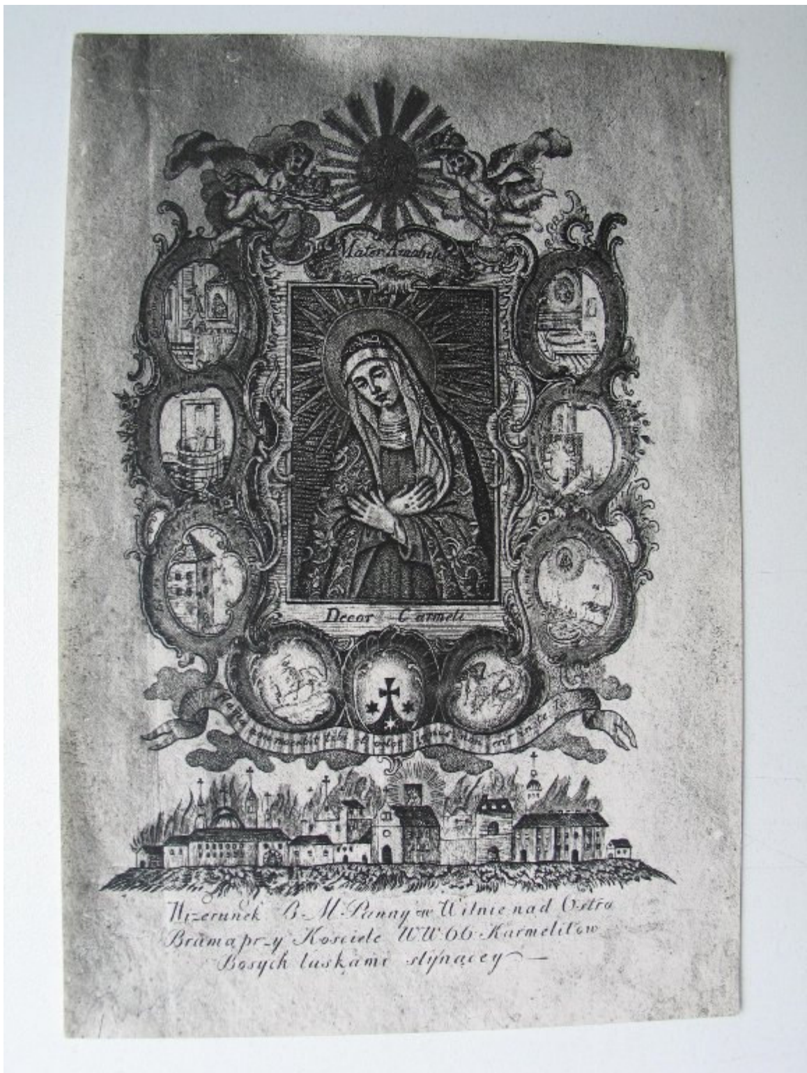
Wizerunek Matki Boskiej Ostrobramskiej według starego sztychu.