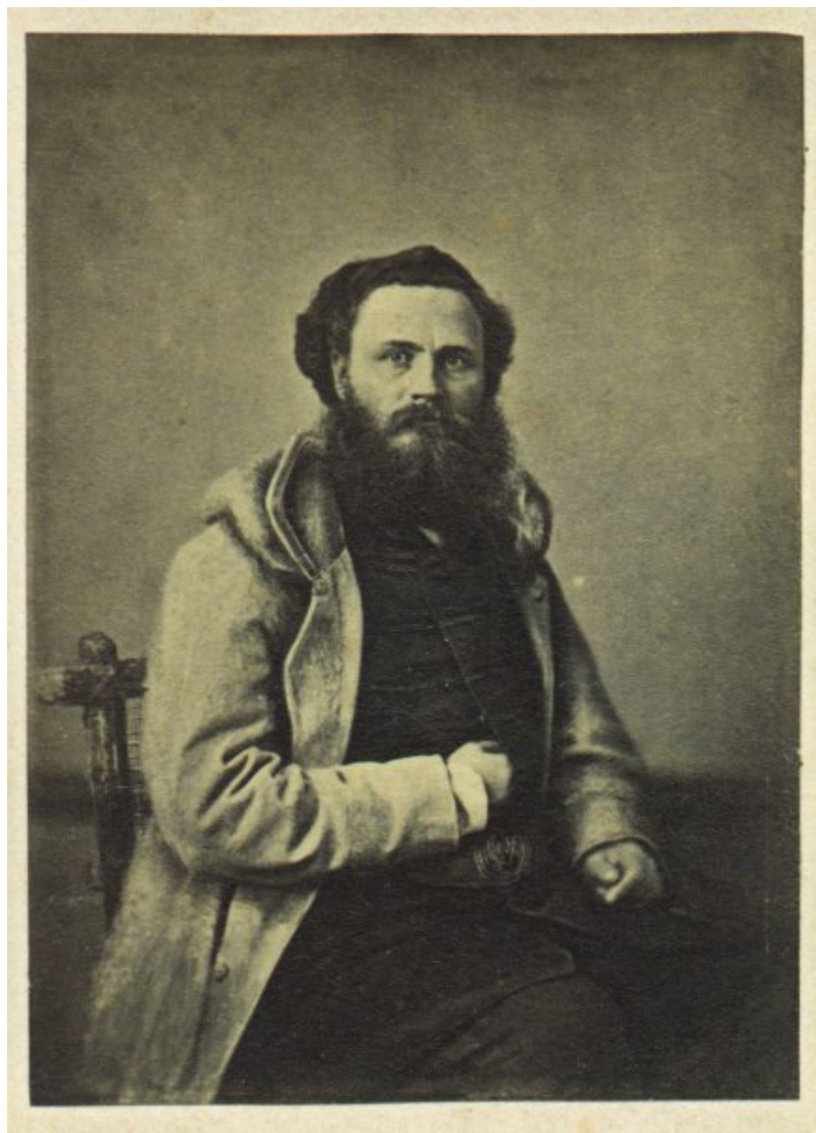
Ludwik Mierosławski (1814 – 1878)