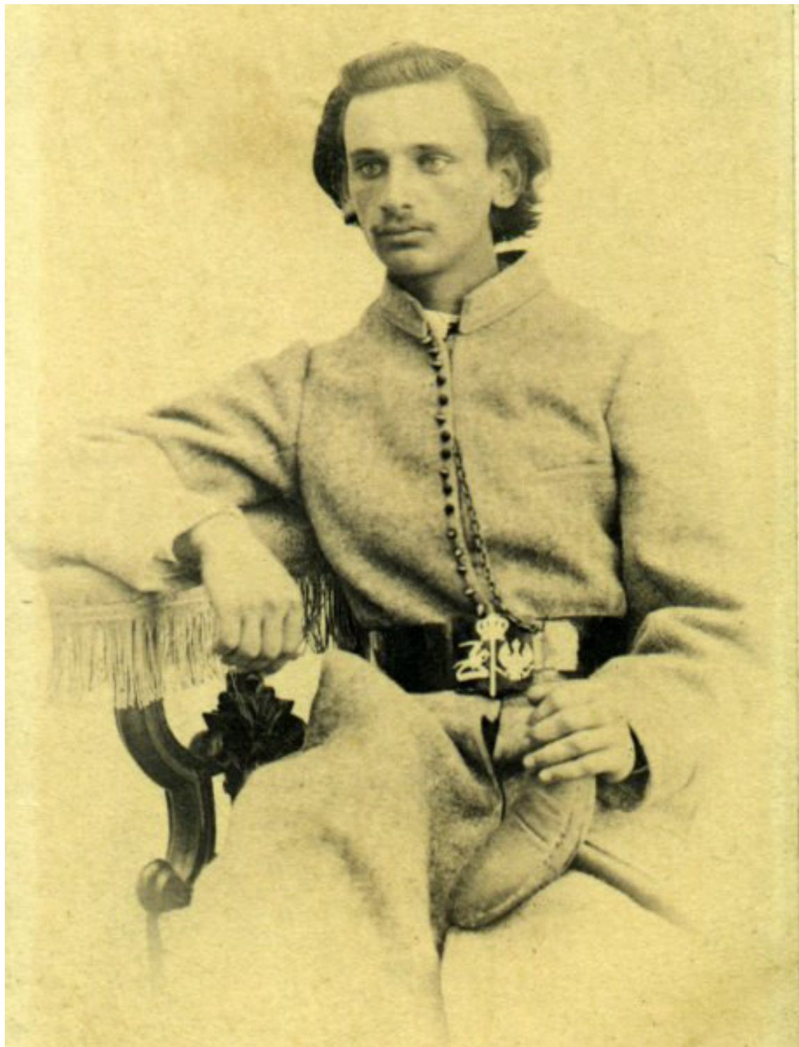
Leon hr. Plater Rozstrzelany w twierdzy Dyneburskiej 27 maja 1863 r.