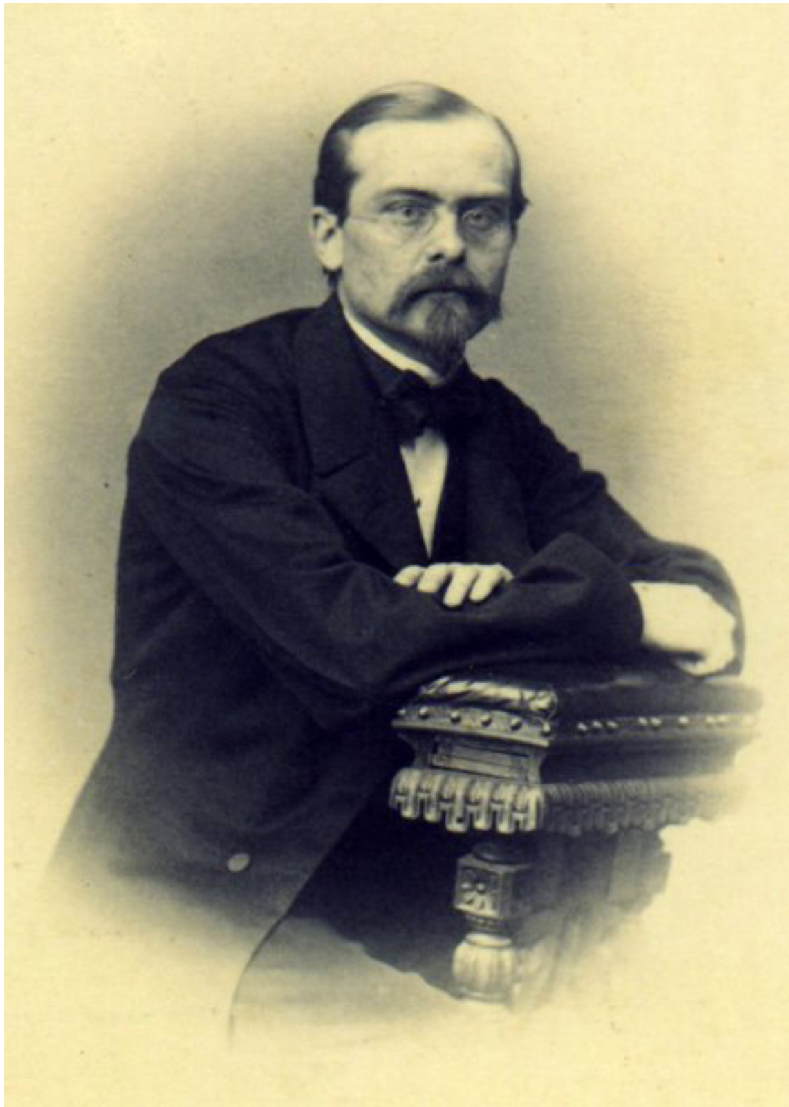
Aleksander Oskierko (1830 – 1911), pochowany na wileńskiej Rossie.