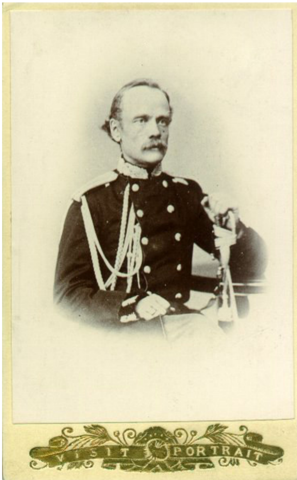
Zygmunt Dołęga Sierakowski (1826 – 1863), syn Ignacego, kapitan sztabu generalnego. Powieszony w Wilnie 15 czerwca 1863 r.