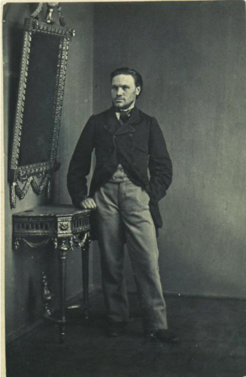
Wincenty Konstanty Kalinowski (1838 – 1864)