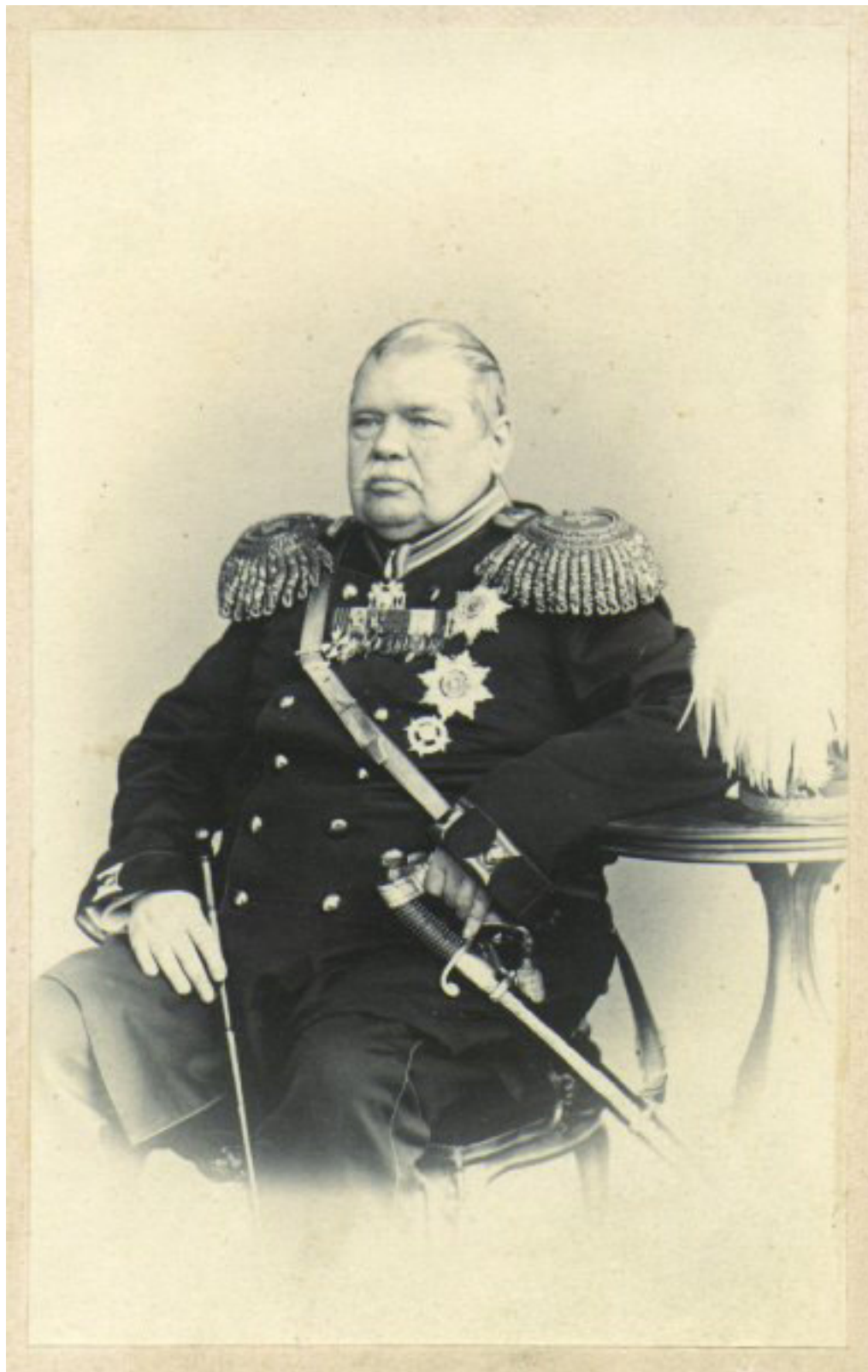
Michał Murawiew (1796 – 1866) - Wieszatiel