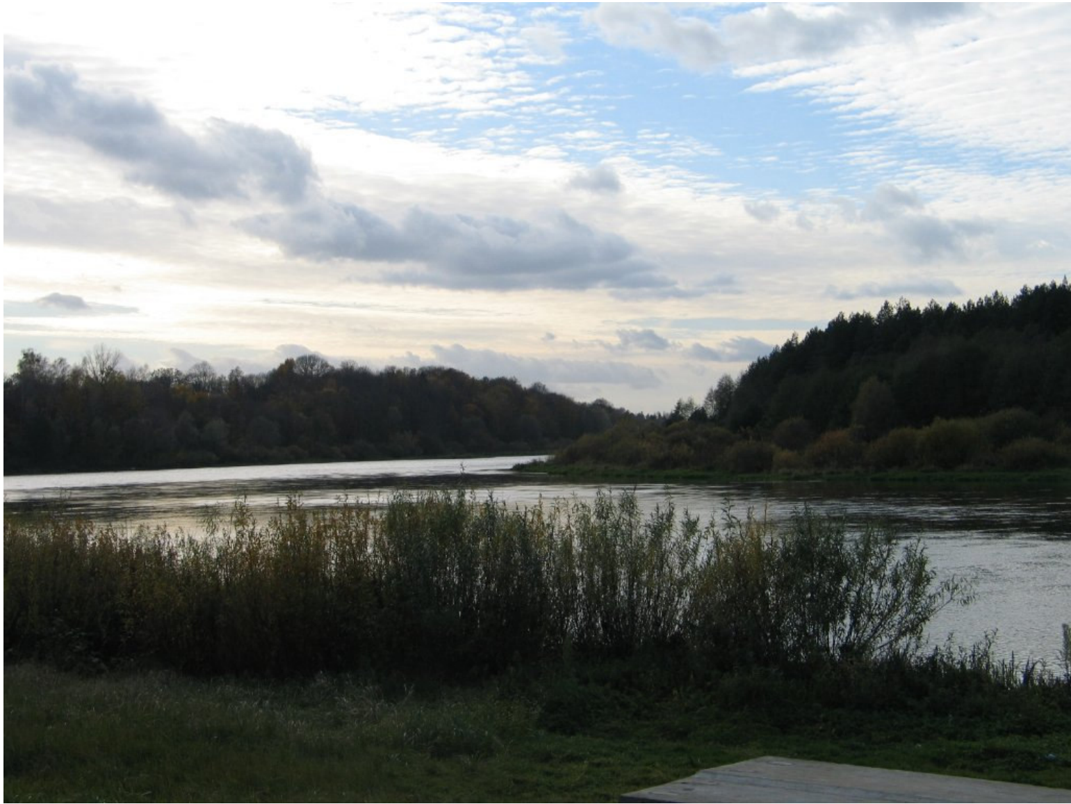
Niemen w okolicy Bohatyrowicze