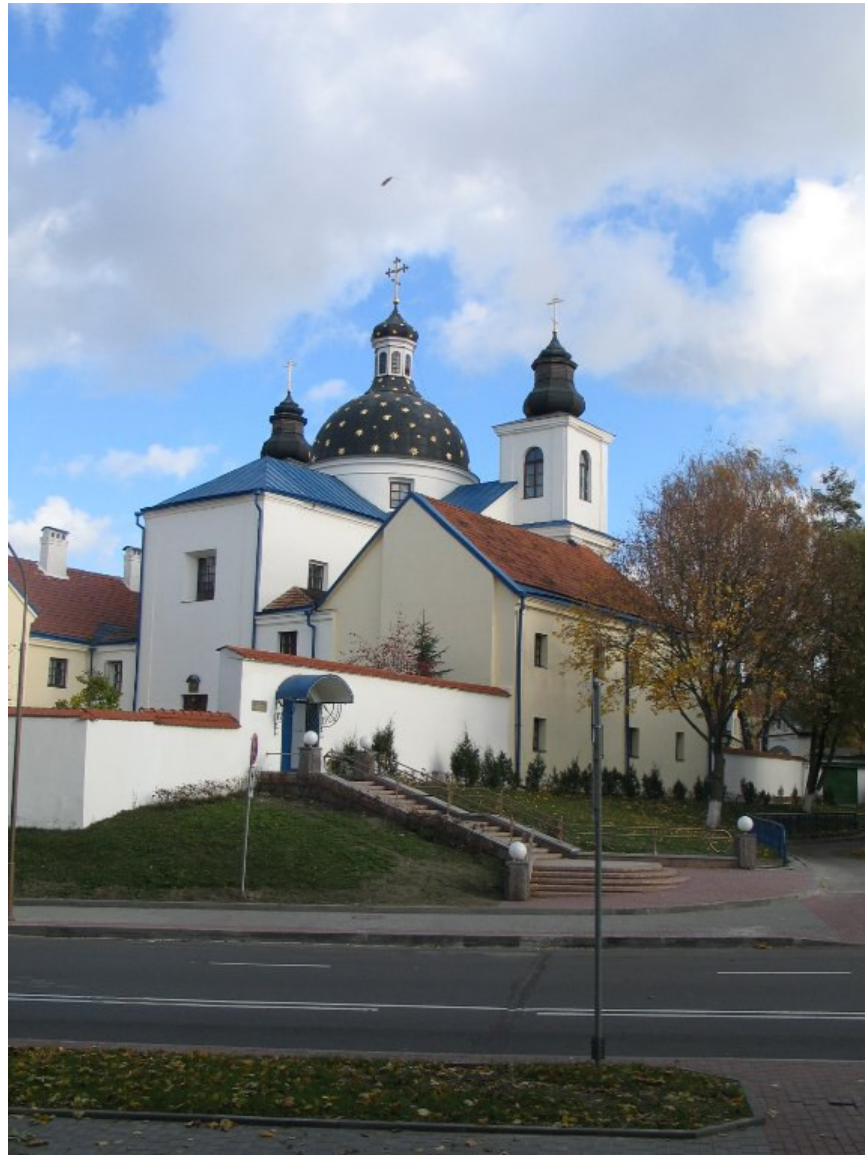
Były kościół P.P. Bazylianek w Grodnie