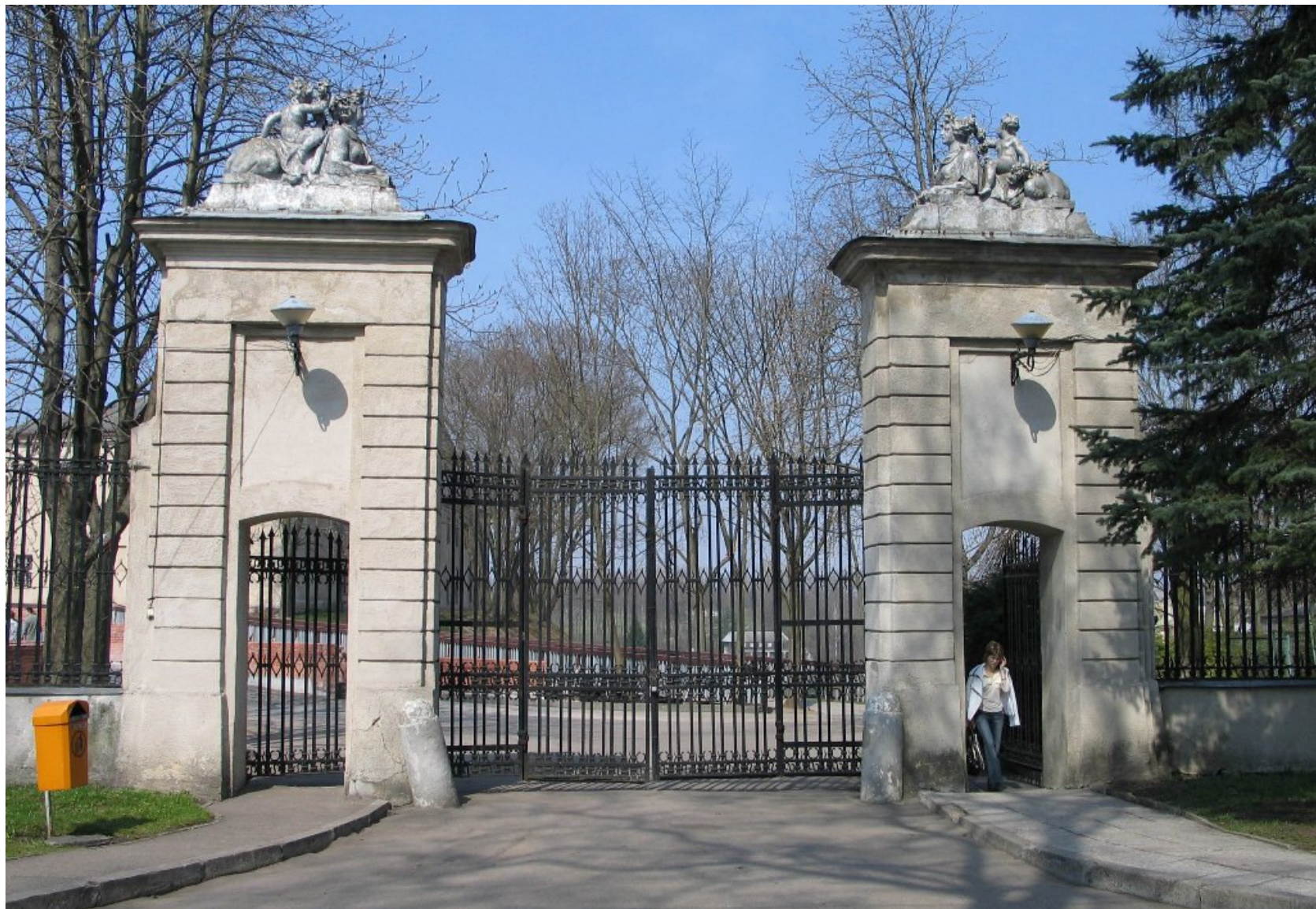
Zamek Nowy. Brama wjazdowa