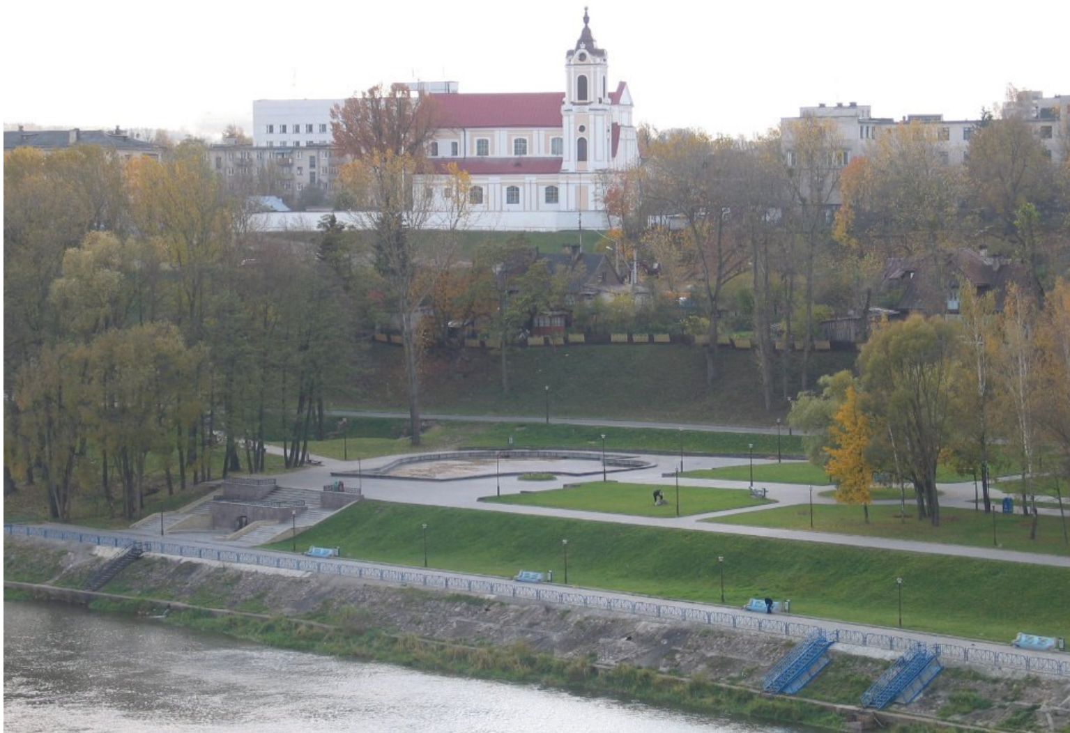
Kościół po- bernardyński