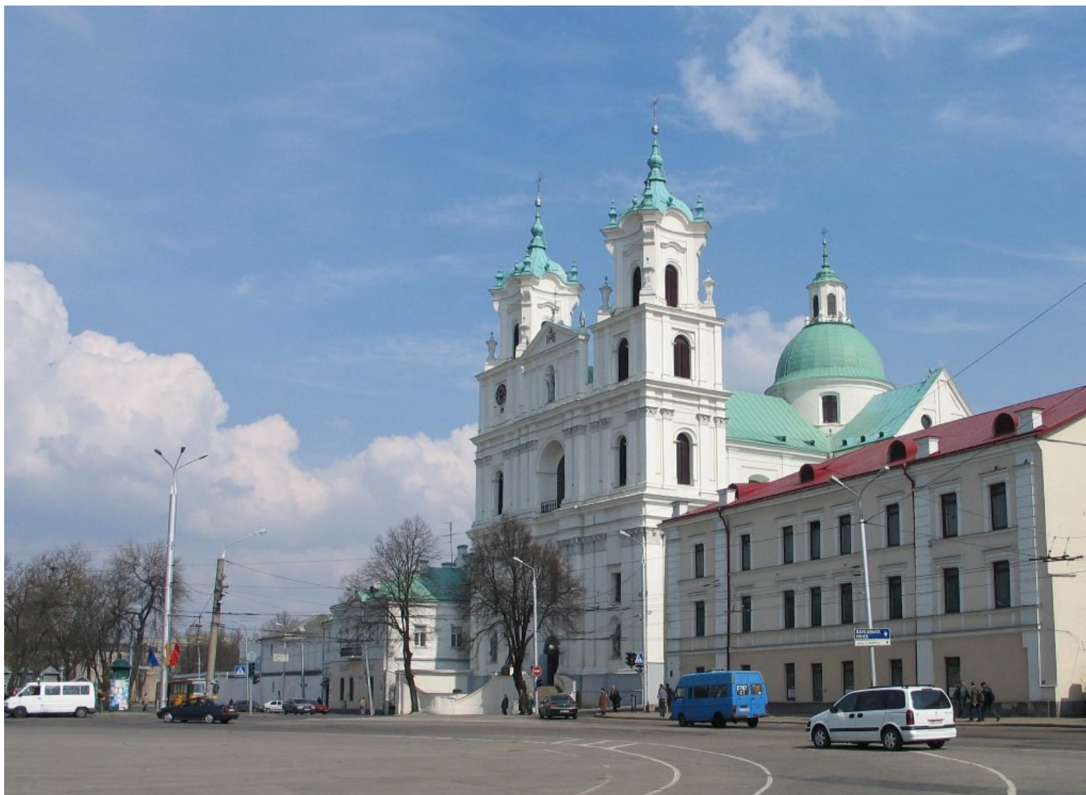
Fara czyli kościół Wniebowzięcia N.M.P.