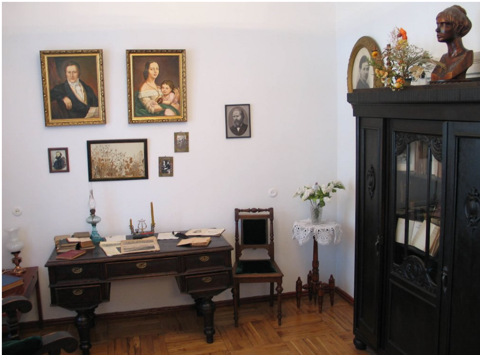
W domu – muzeum E. Orzeszkowej w 2005 r.