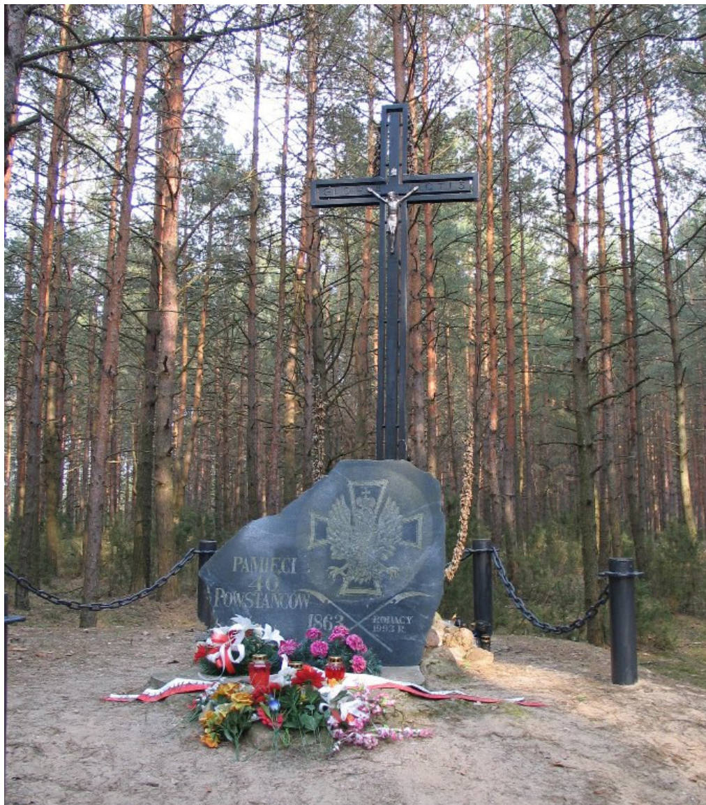
Grób powstańców 1863 roku w okolicy Bohatyrowicze