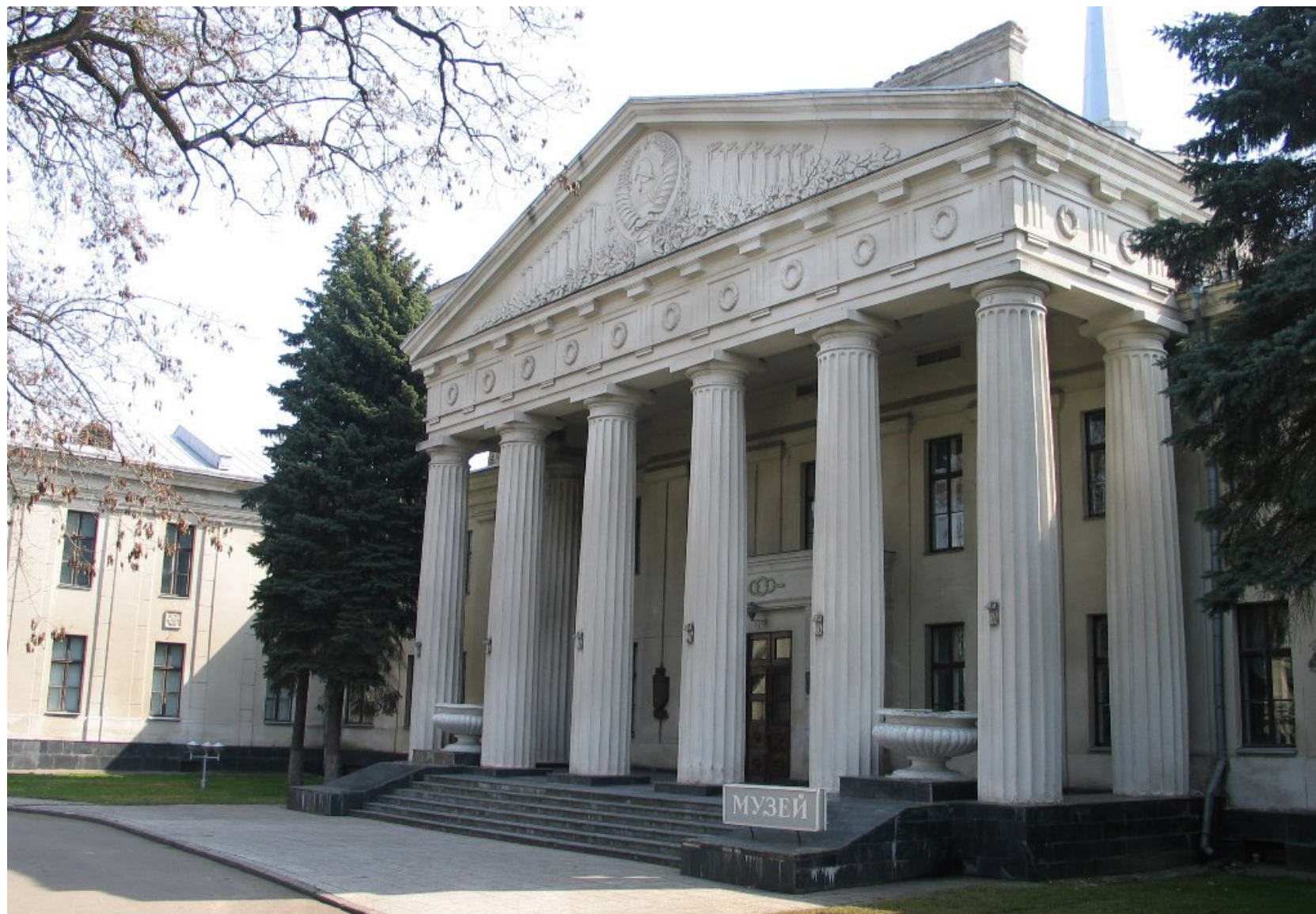
Zamek Nowy w Grodnie w 2005 r.