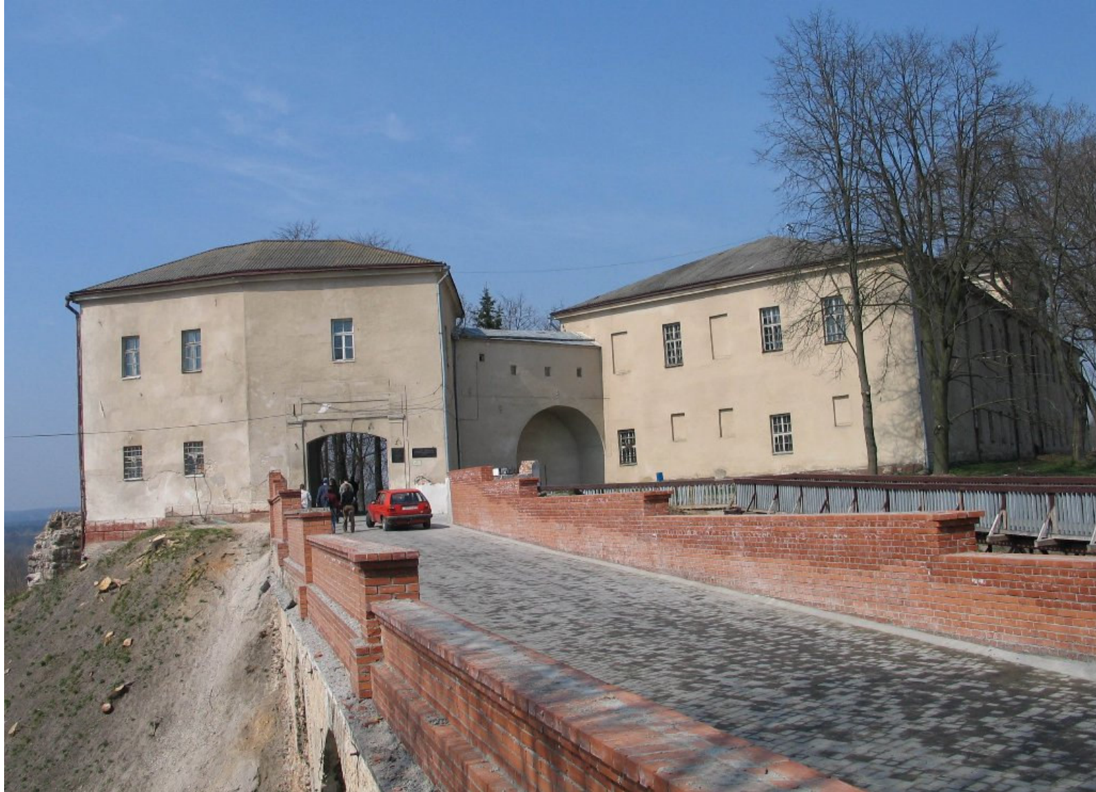
Zamek Stary w Grodnie