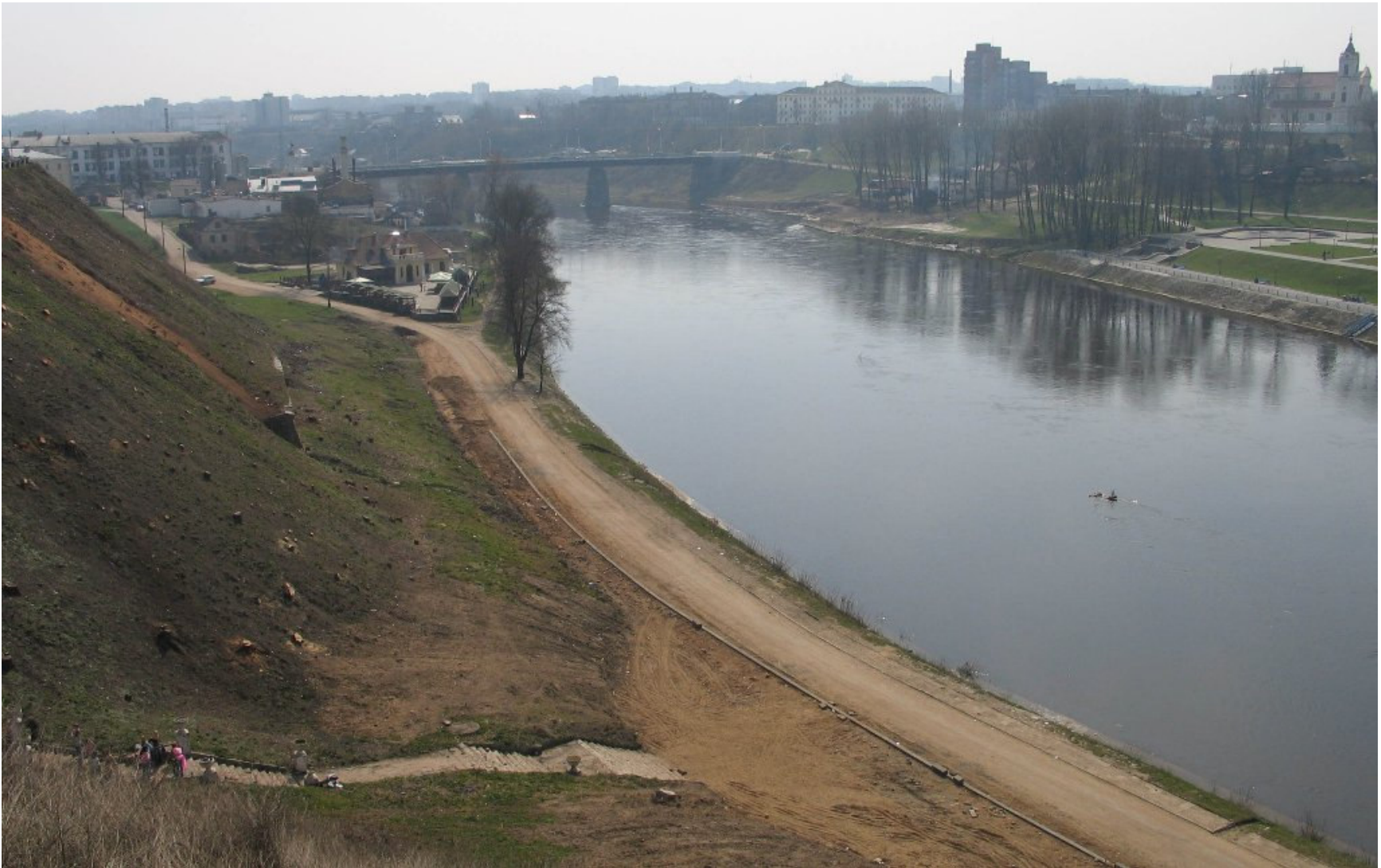
Widok z Zamku Nowego