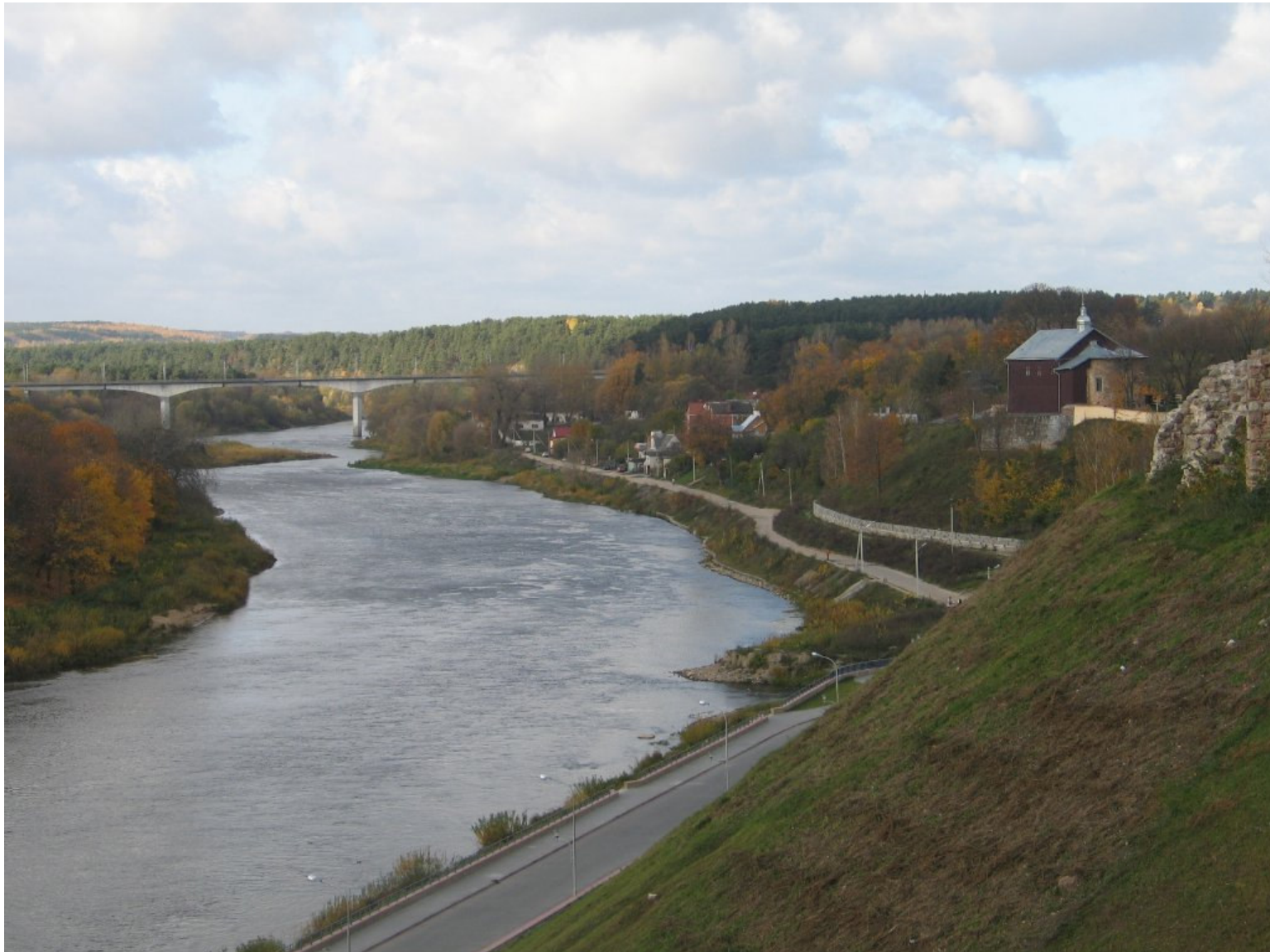
Widok z Zamku Nowego