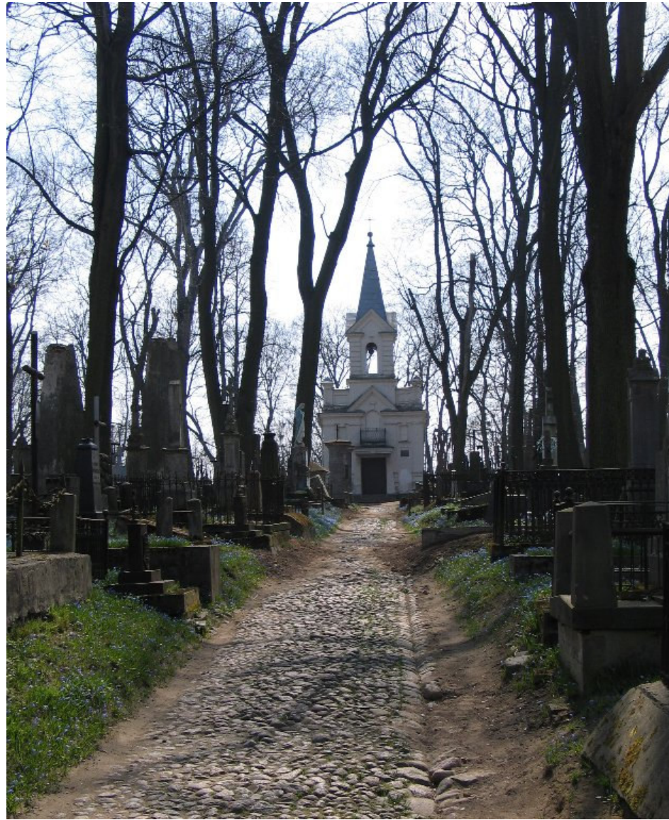
Stary cmentarz w Grodnie