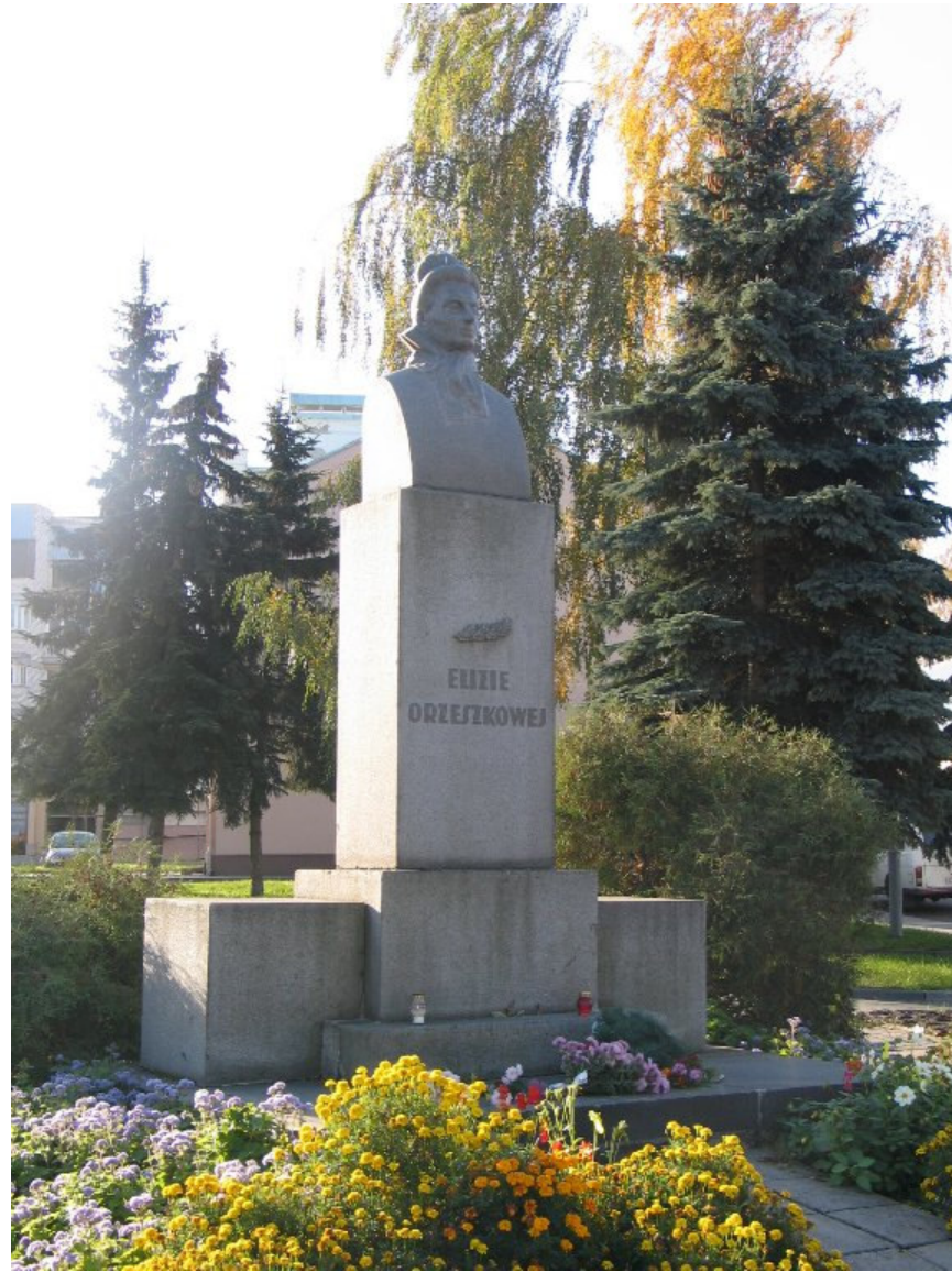
Pomnik E. Orzeszkowej z okresu międzywojnia w 2005 r.