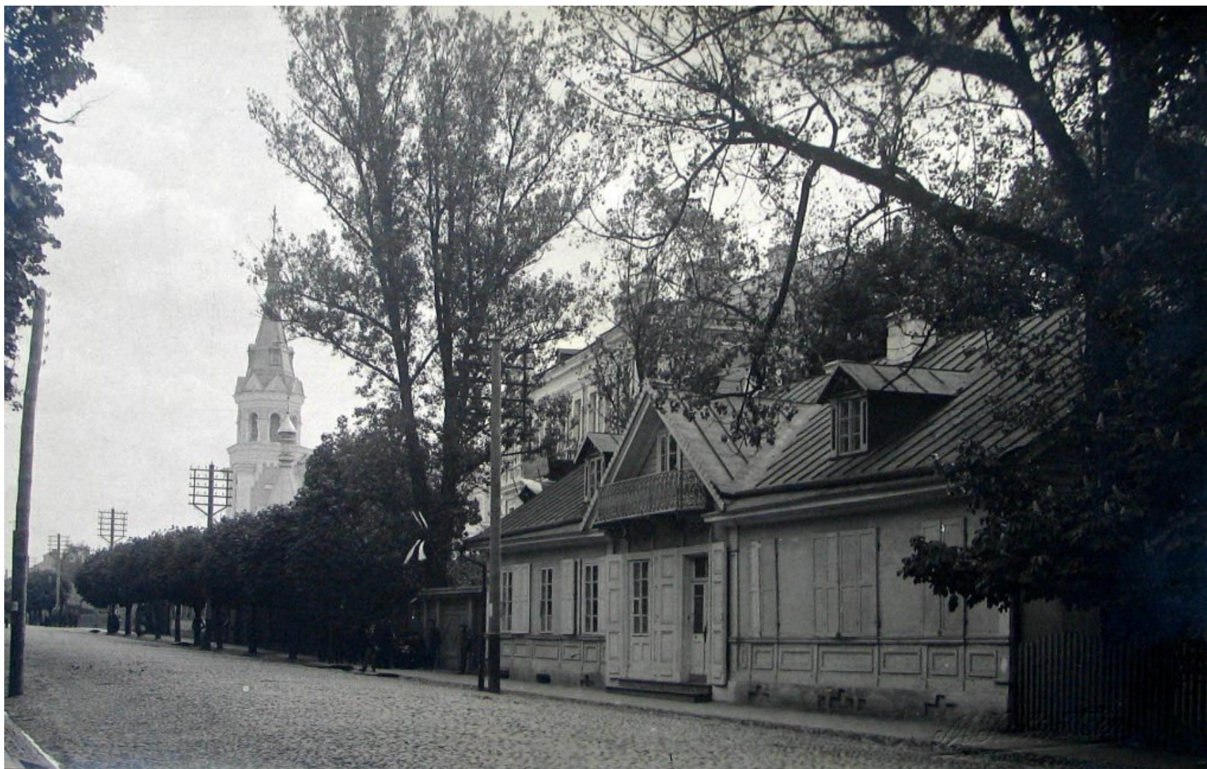
Dom Elizy Orzeszkowej w 1910 r.