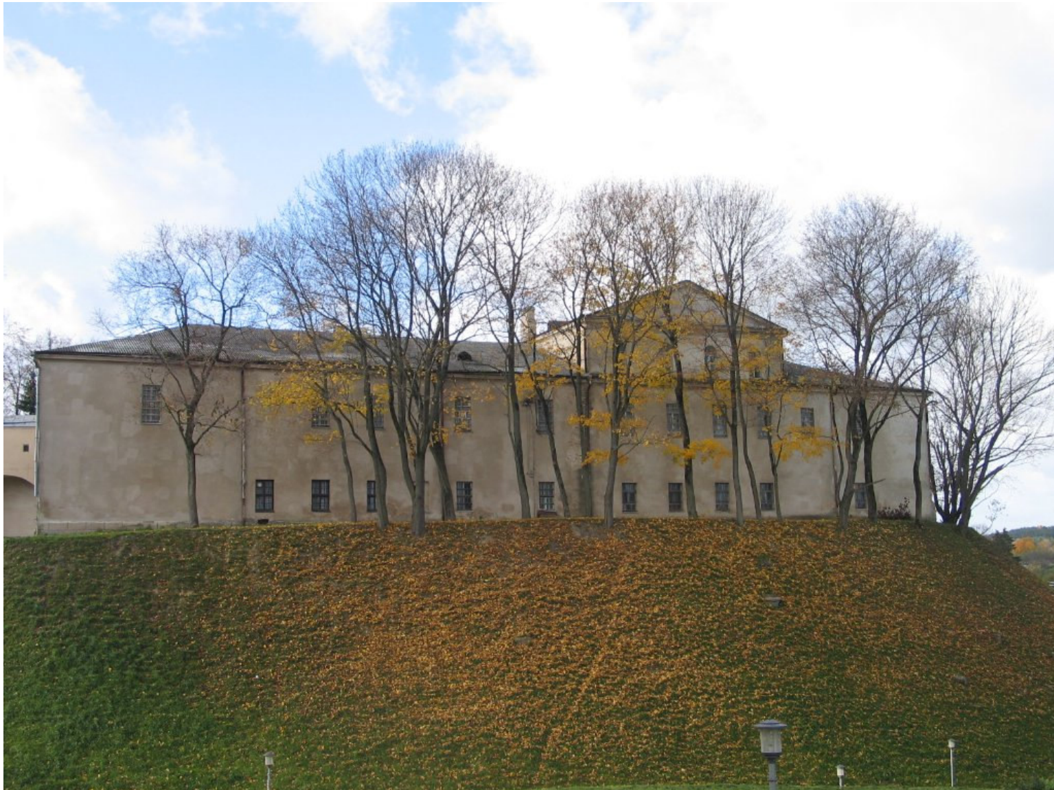
Zamek Stary w Grodnie