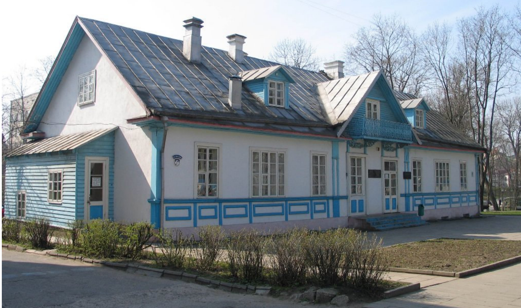
Dom – muzeum Elizy Orzeszkowej w 2005 r.