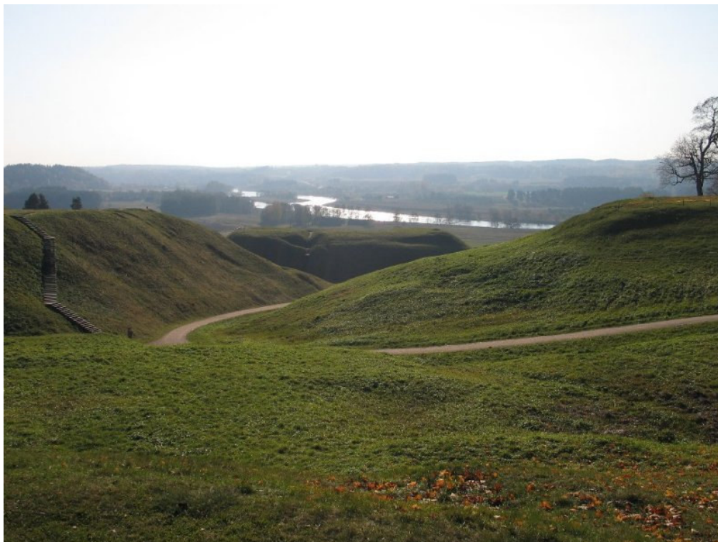
Widok na Wilię (2008 r.).