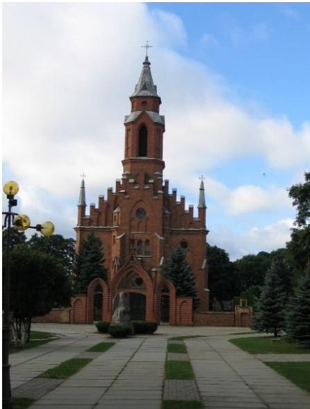
Neogotycki kościół p.w. Wniebowzięcia NMP zbudowany w 1924 r. (2005 r.)

N. Rouba , Przewodnik po Litwie i Białejrusi, 1908