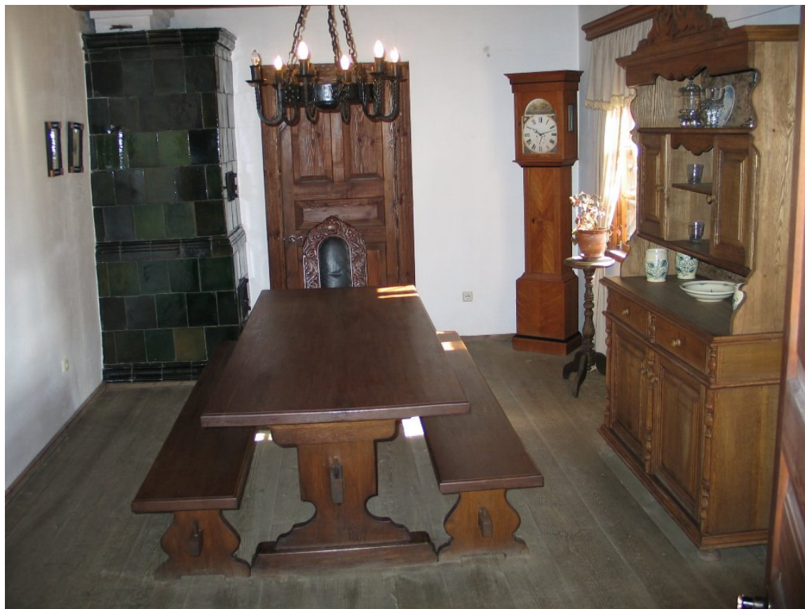
W dworku Mickiewiczowskim