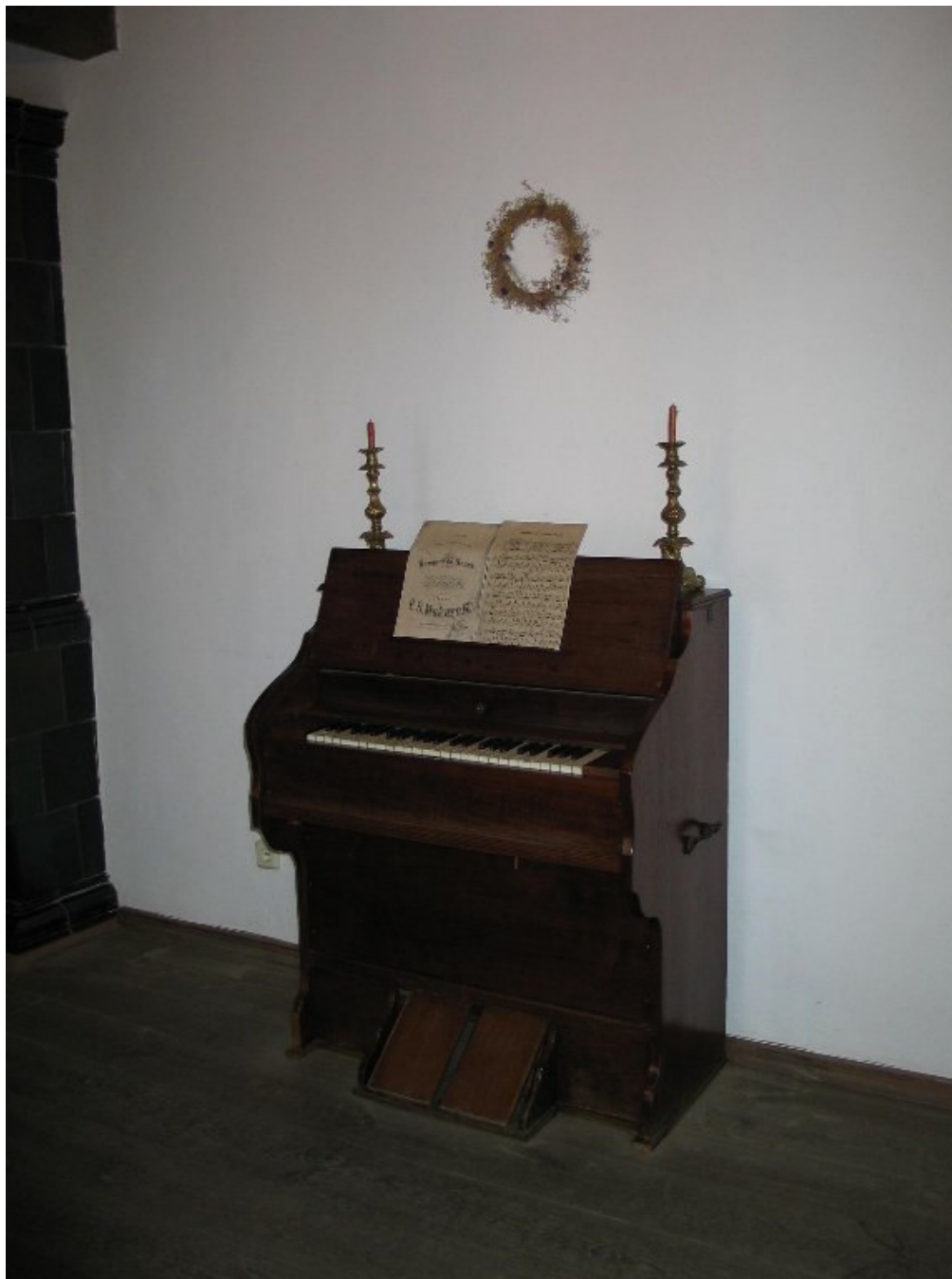
W dworku Mickiewiczowskim