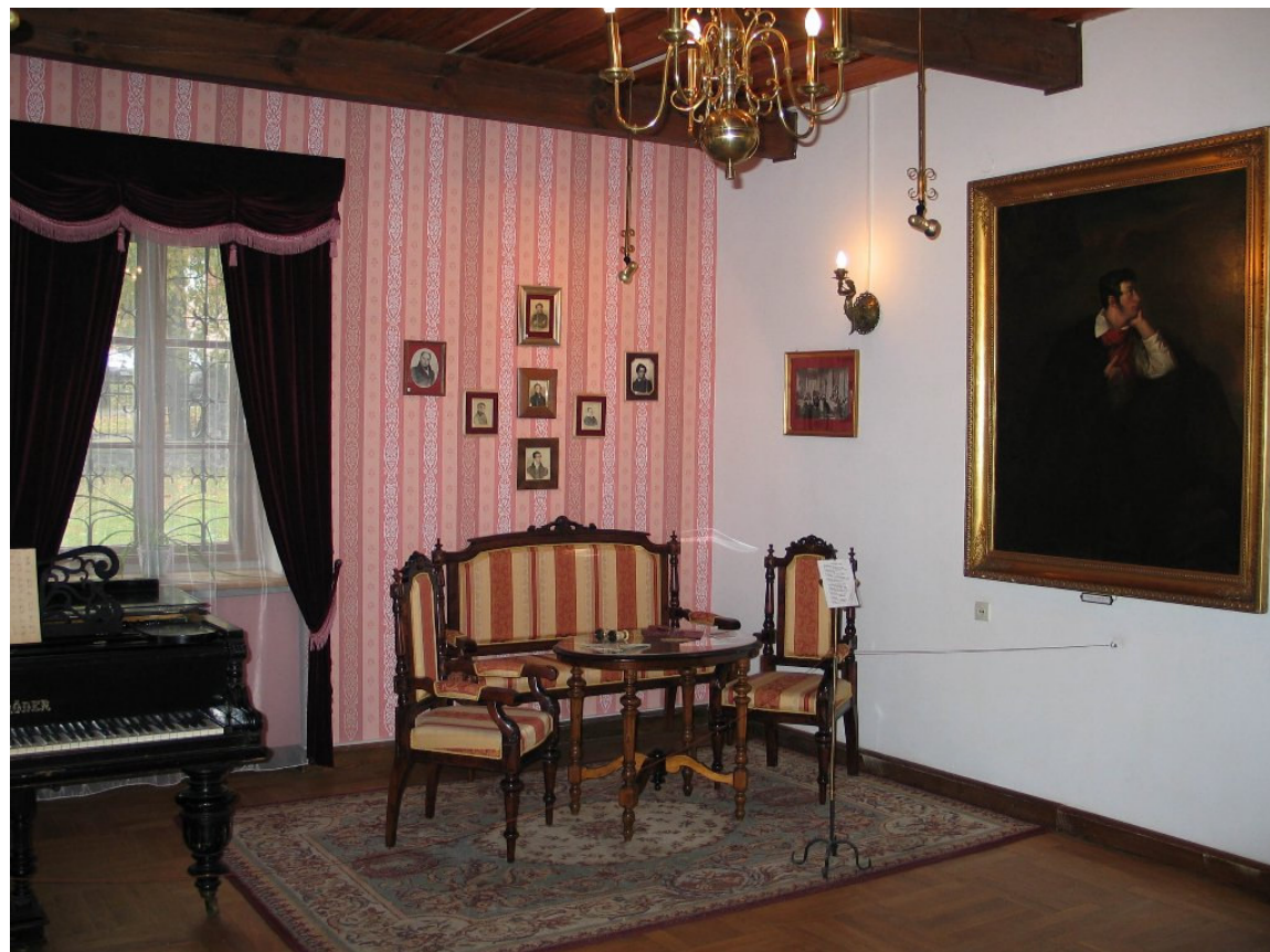
W domu – muzeum A.Mickiewicza