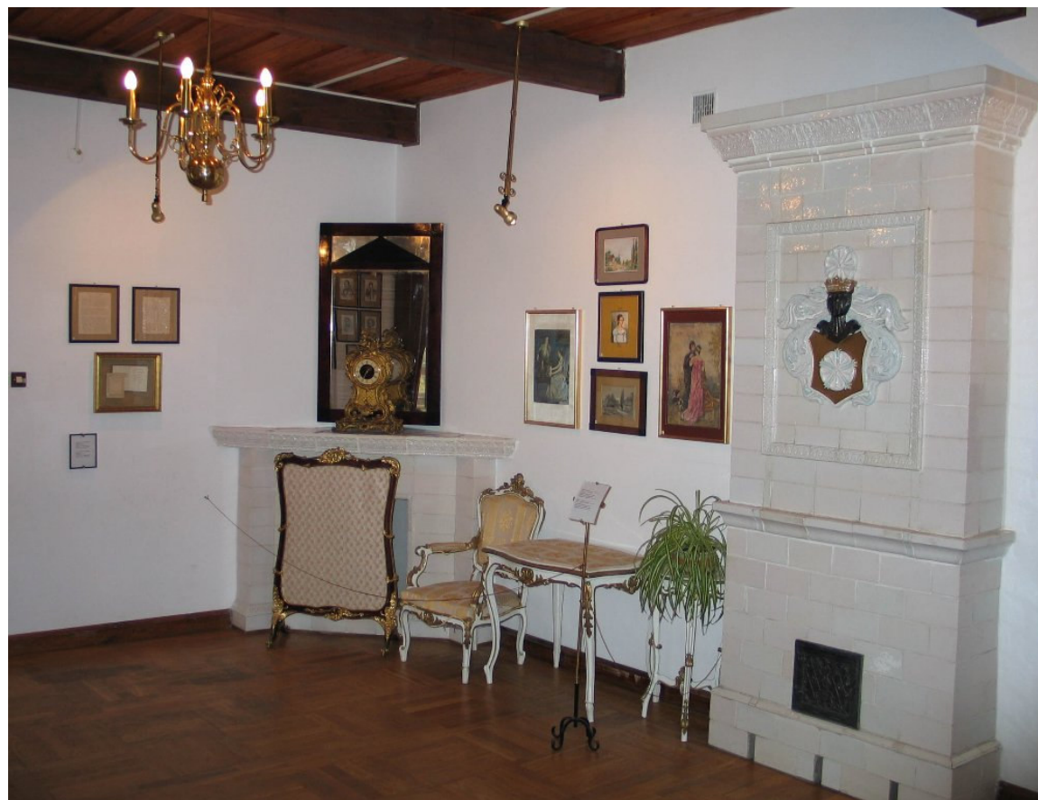
W domu – muzeum A. Mickiewicza