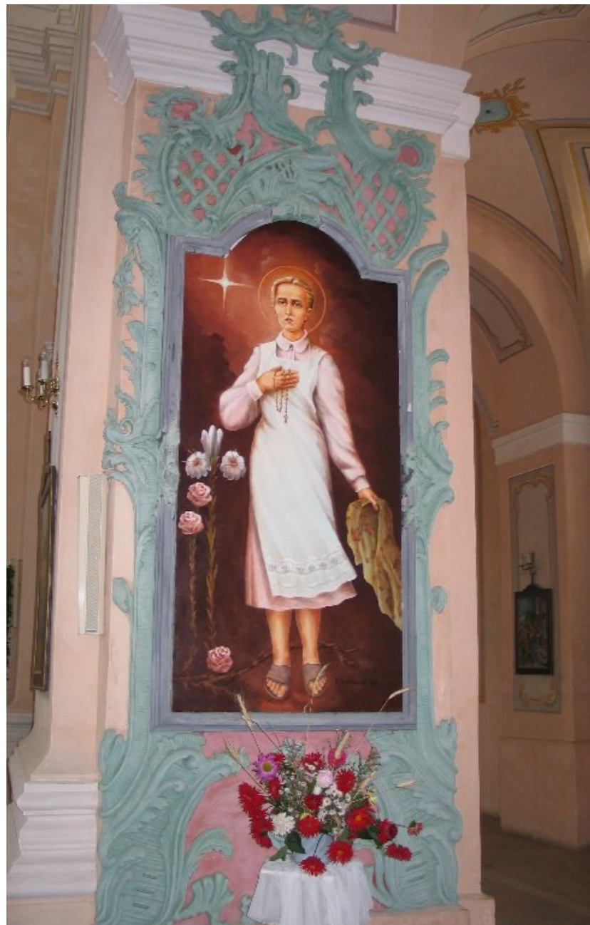
W kościele św. Michała