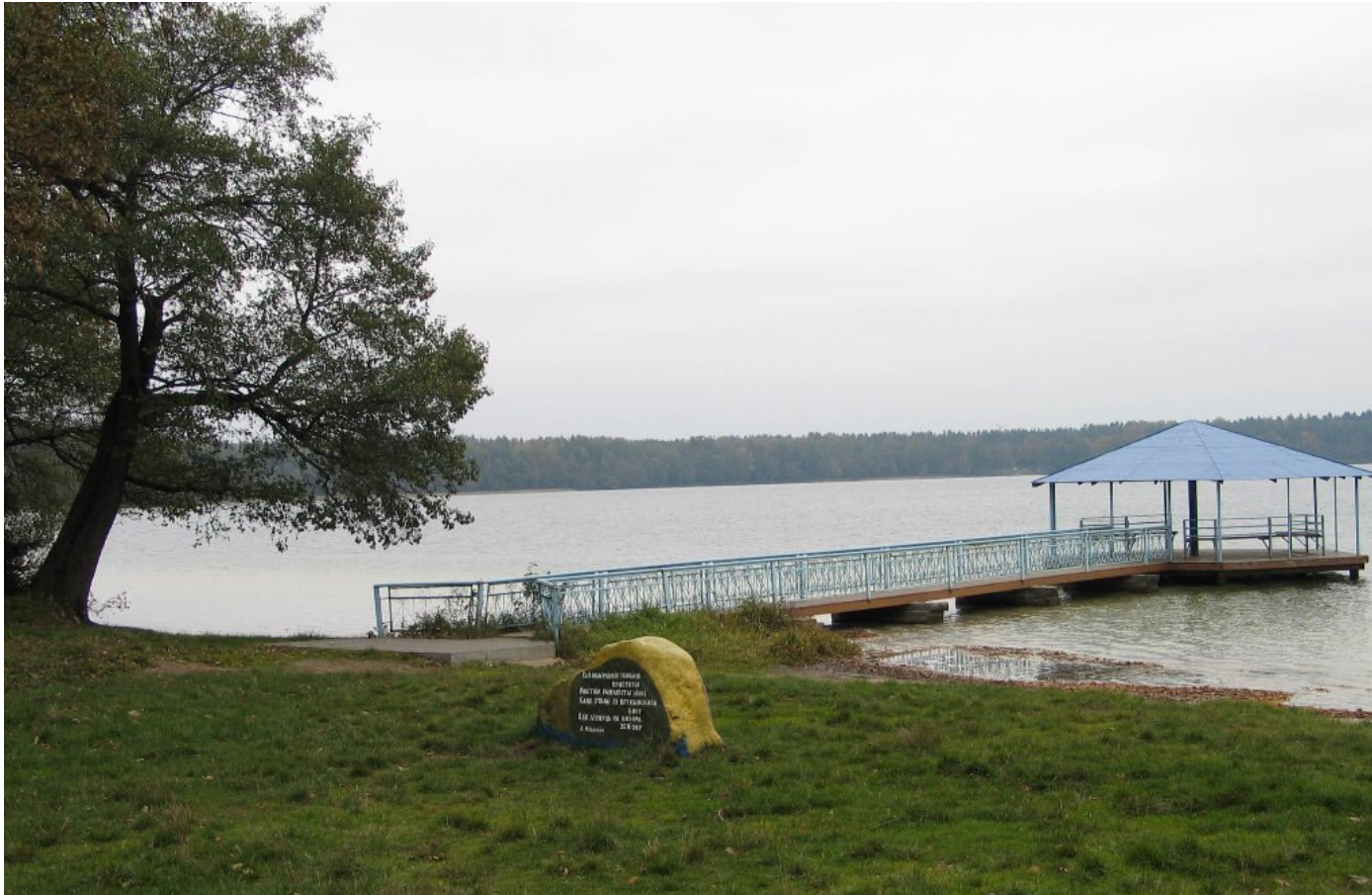
Jezioro Świtezkie w 2005 r.