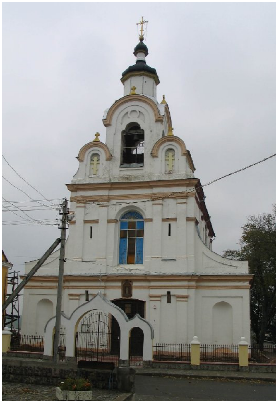
Cerkiew w Nowogródku