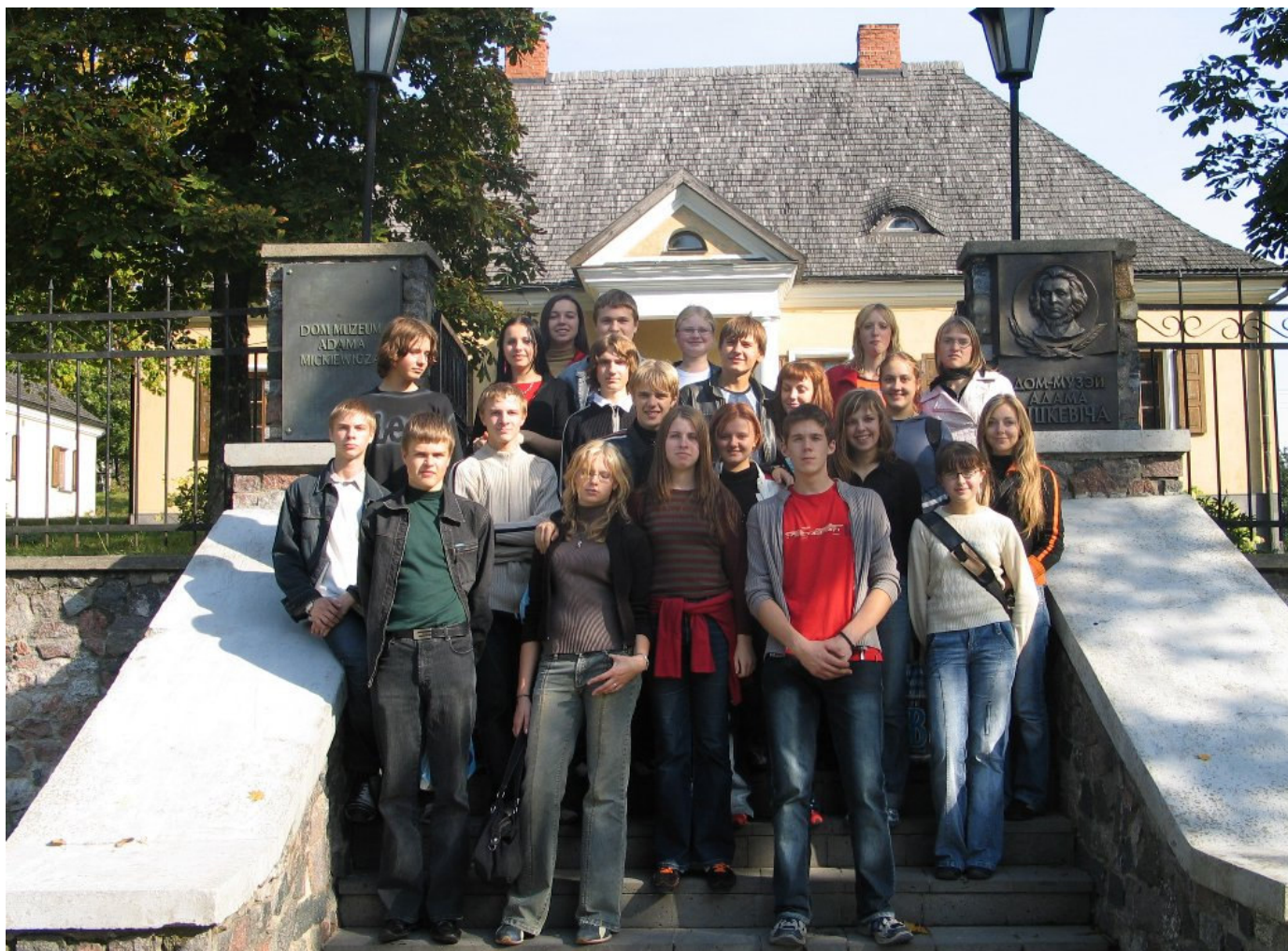
Uczniowie z wileńskiego gimnazjum A. Mickiewicza przed muzeum swego Patrona w Nowogródku w 2005 r.