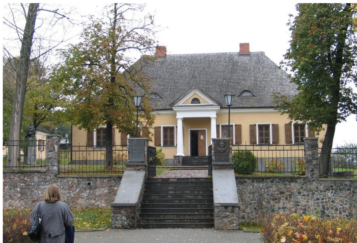
Dom – muzeum A. Mickiewicza w 2004 r.