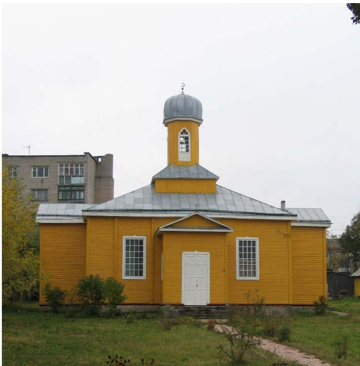
Meczet w Nowogródku