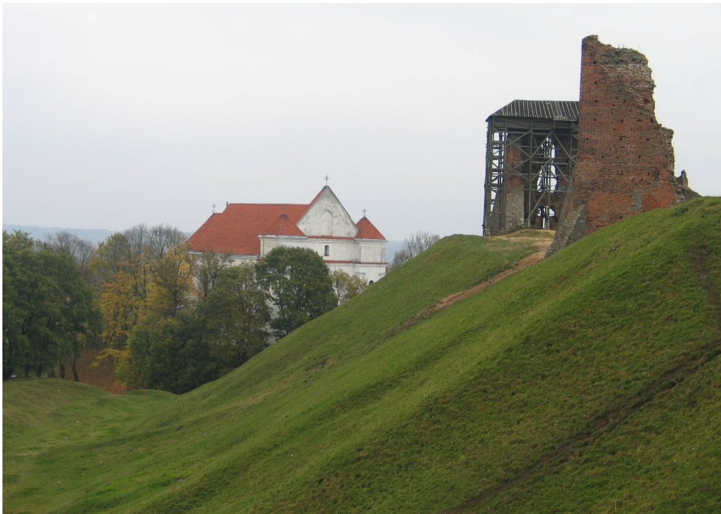
Ruiny zamku w Nowogródku