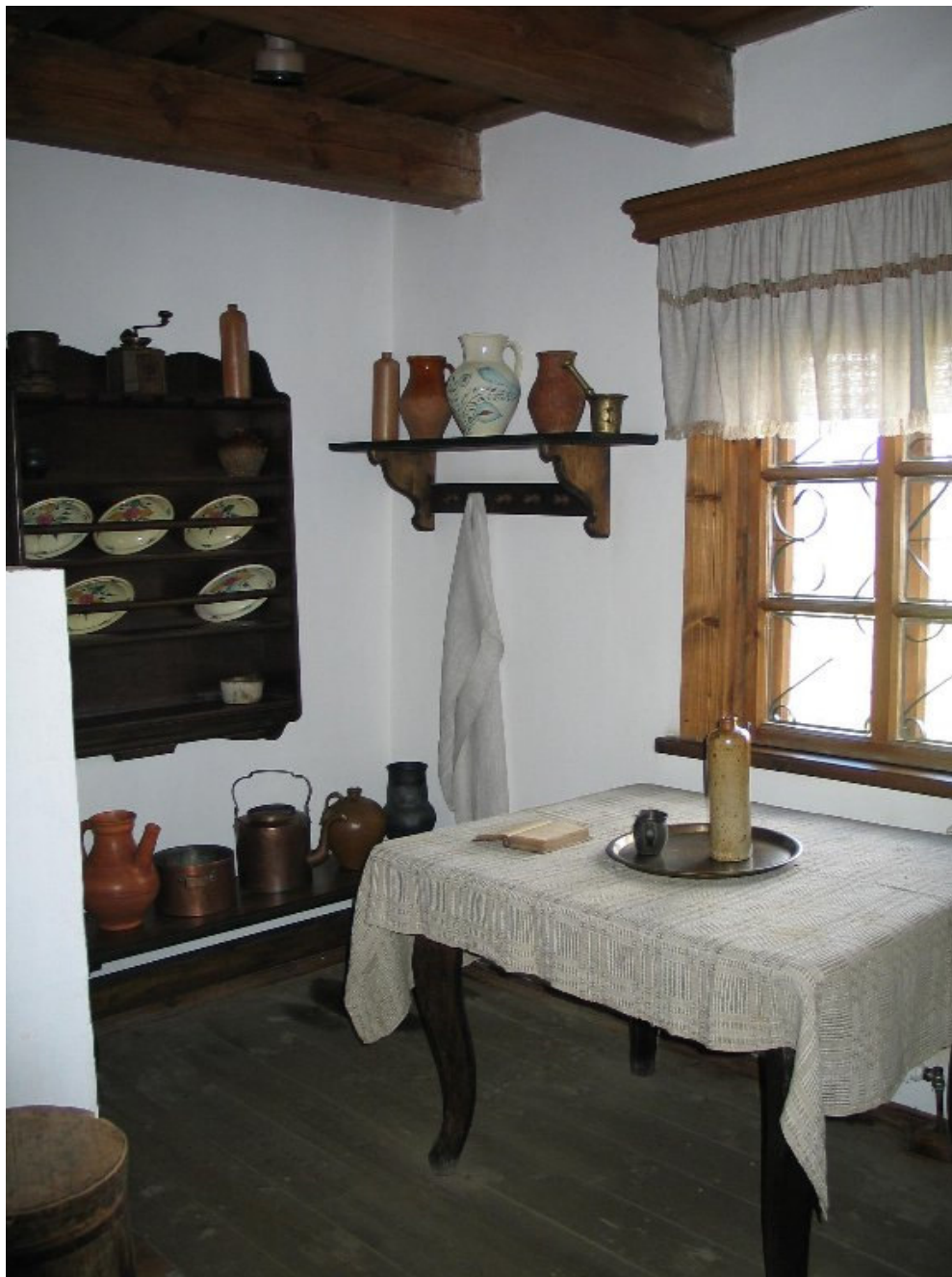
W dworku Mickiewiczowskim