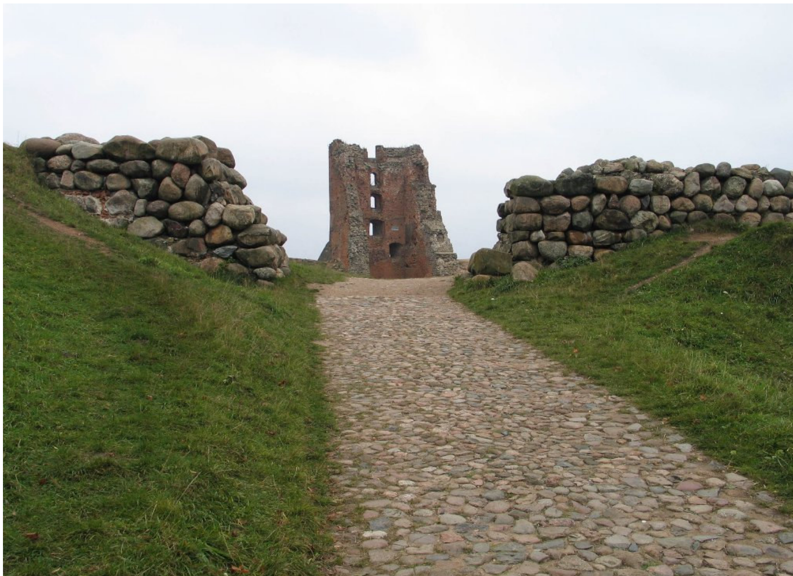
Droga do zamku