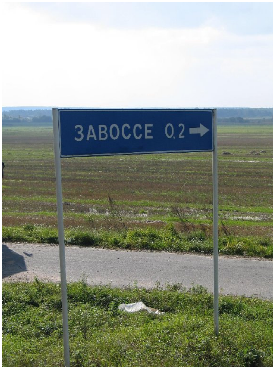
Drogowskaz do Zaosia