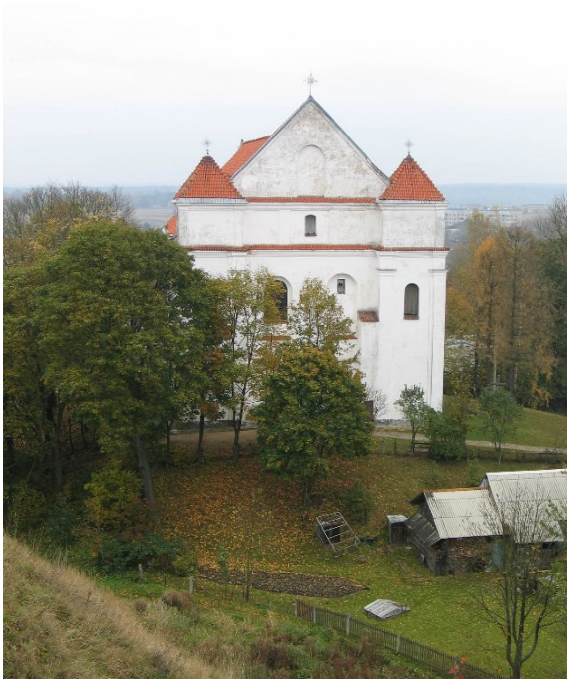
Kościół, w którym był chrzczony A. Mickiewicz