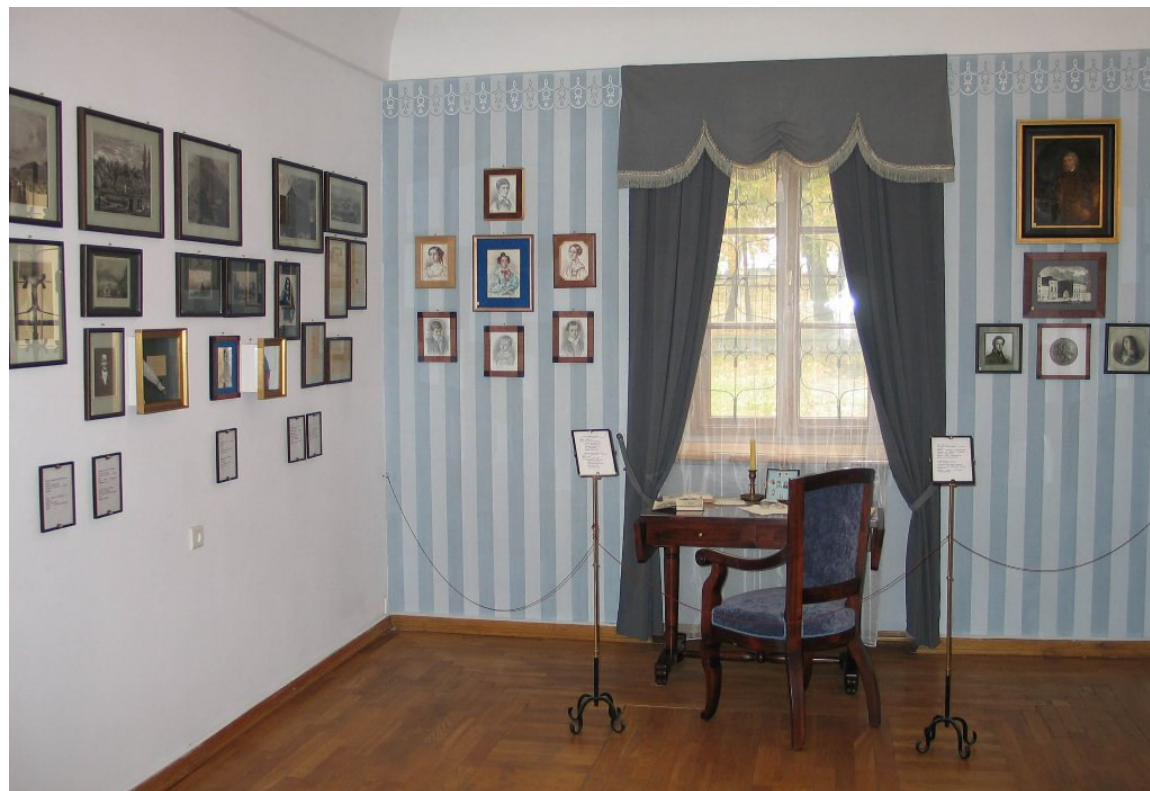
W domu – muzeum A. Mickiewicza