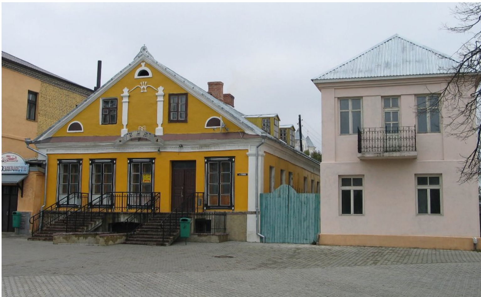
Kamieniczki na rynku miejskim