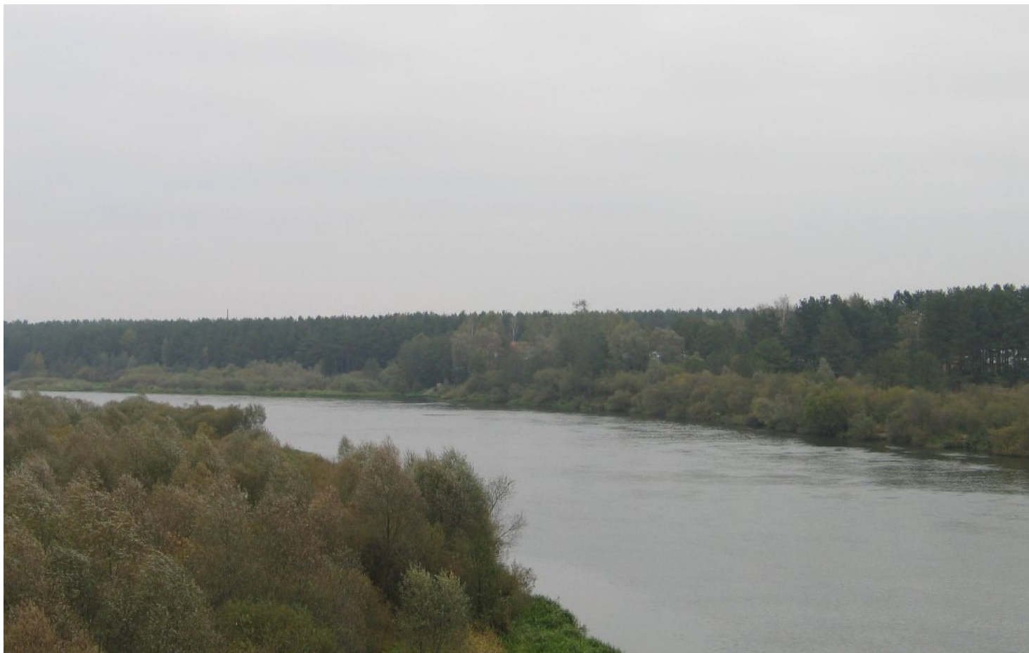
Niemen pod Nowogródkiem