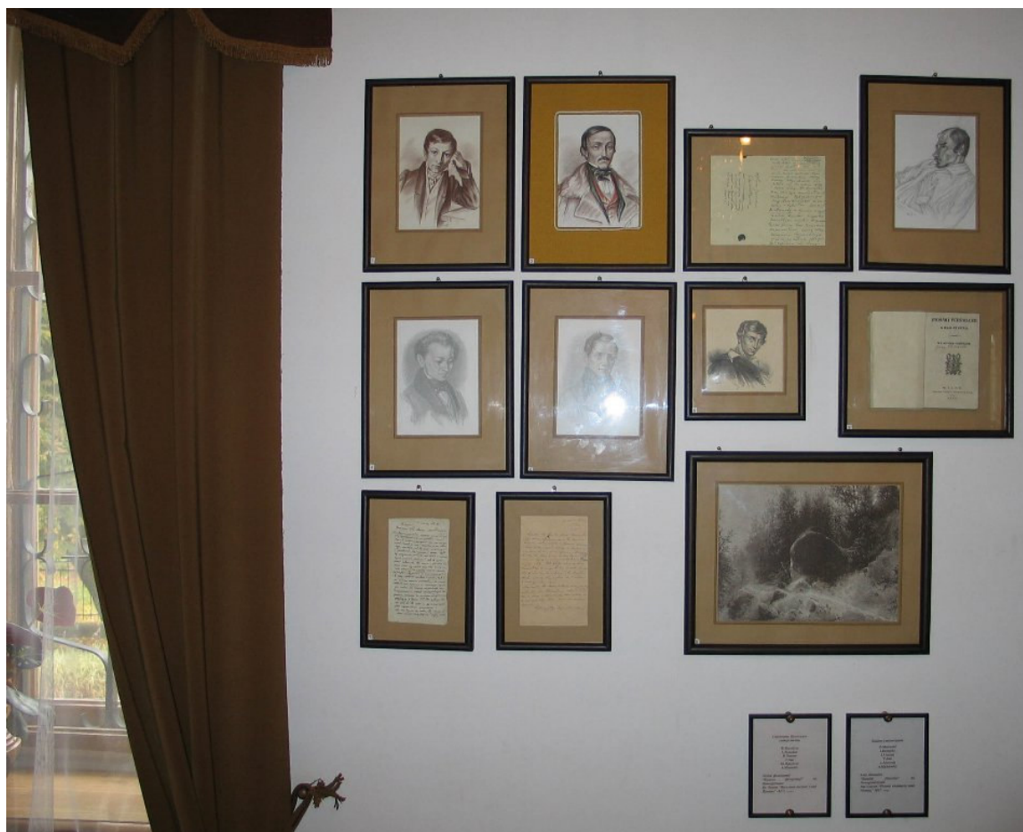
W domu – muzeum A. Mickiewicza