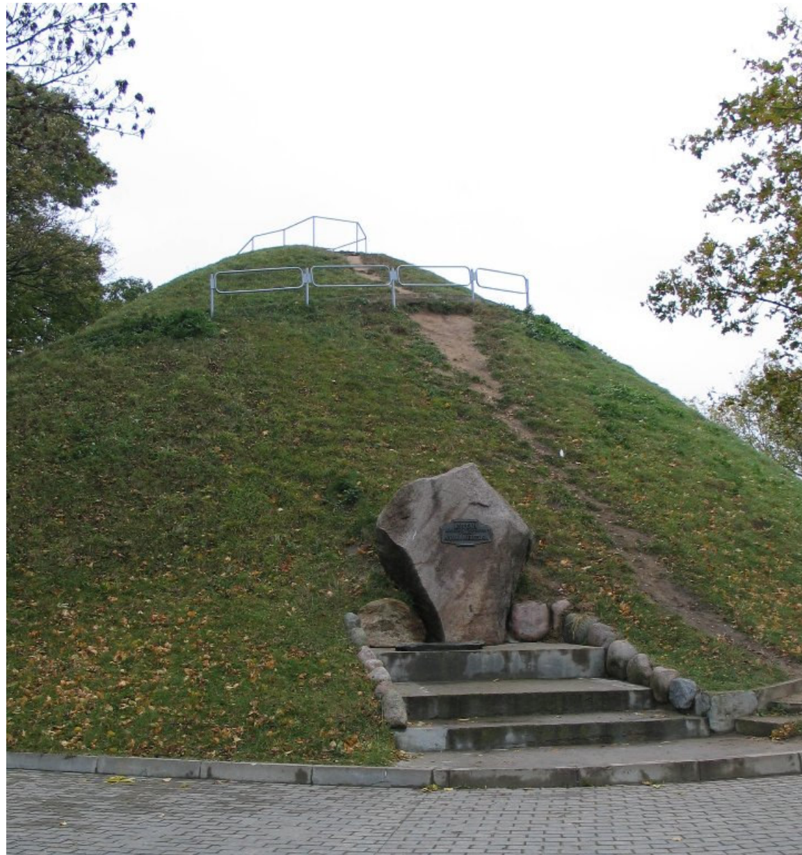
Kopiec A. Mickiewicza