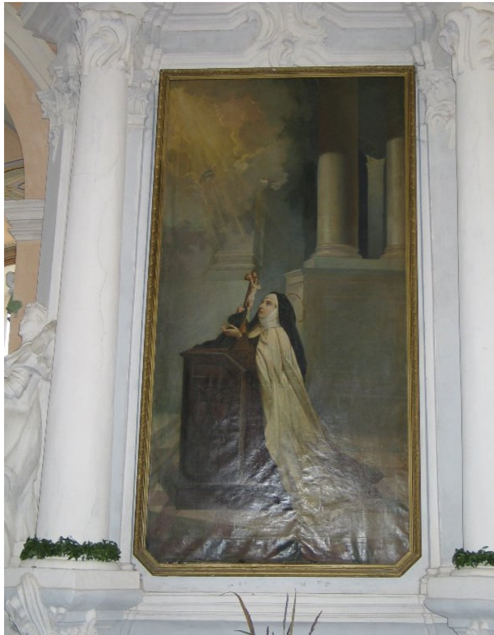
W kościele św. Michała