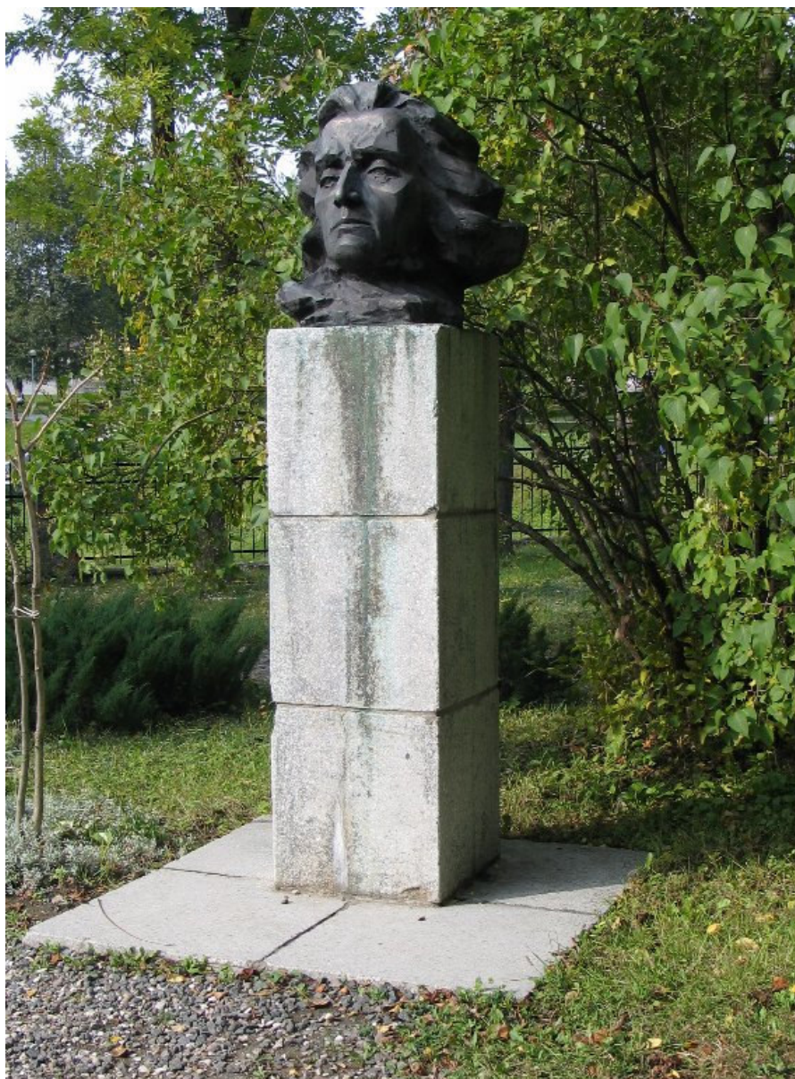
Pomnik A. Mickiewicza przy muzeum