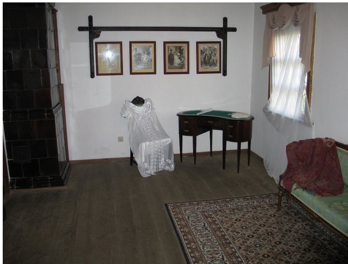
W dworku Mickiewiczowskim