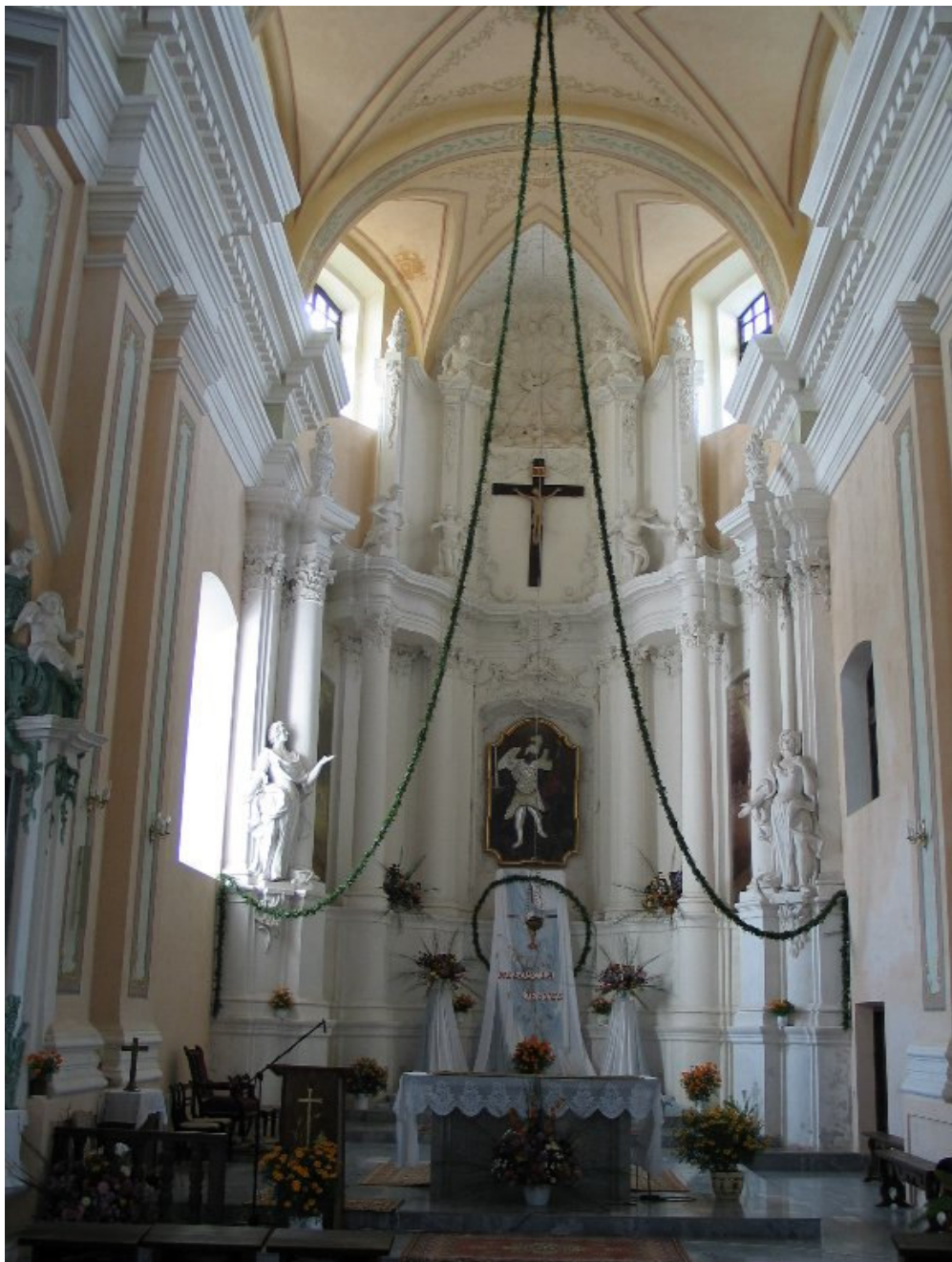
Ołtarz główny w kościele św. Michała