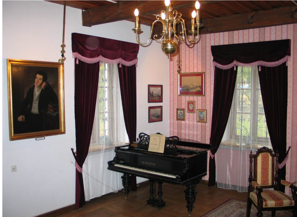
W domu – muzeum A. Mickiewicza