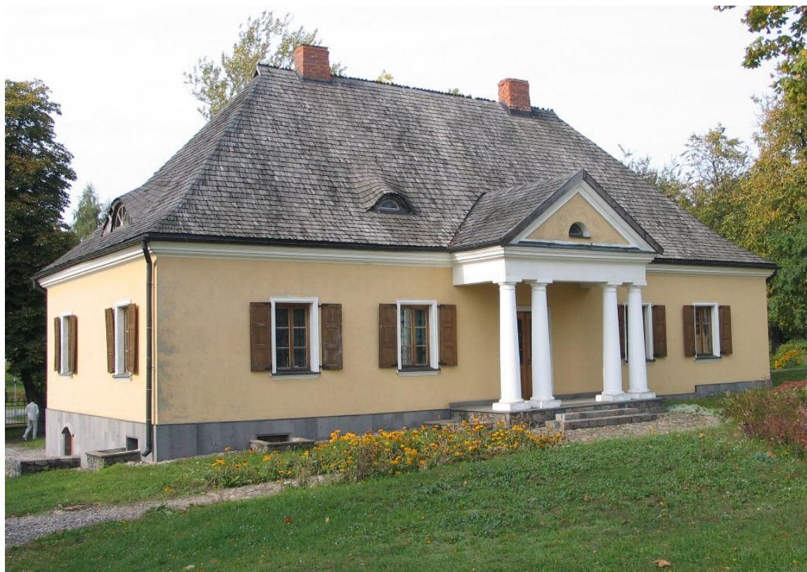
Dom – muzeum A. Mickiewicza w 2004 r.