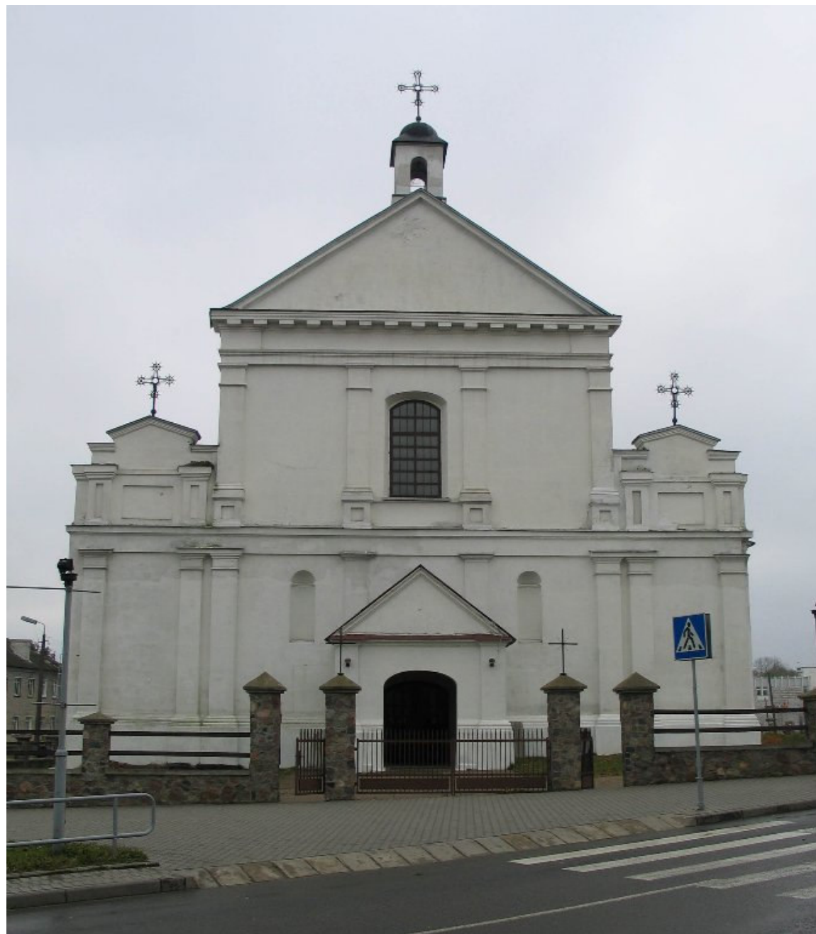
Kościół św. Michała