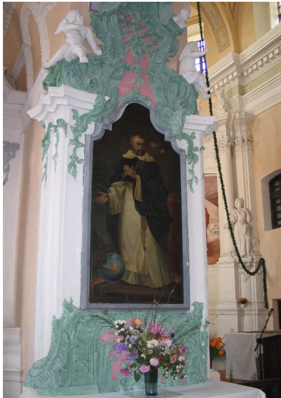
W kościele św. Michała