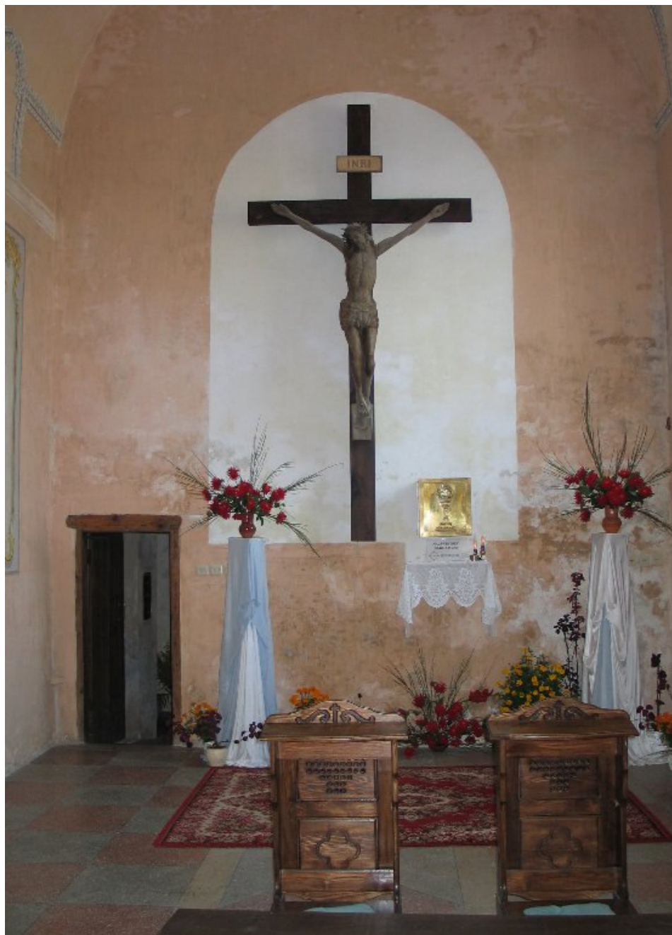
W kościele św. Michała