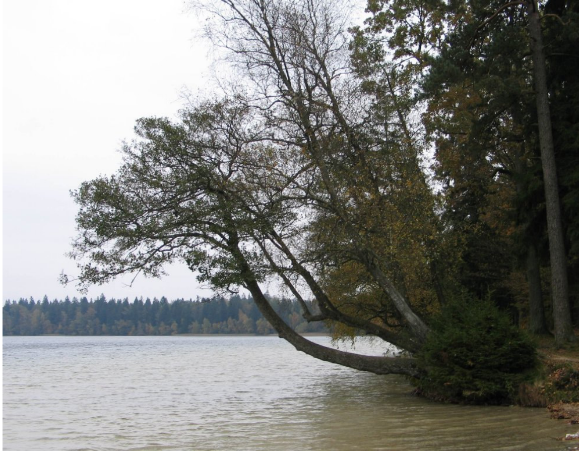
Jezioro Świtezkie w 2005 r.