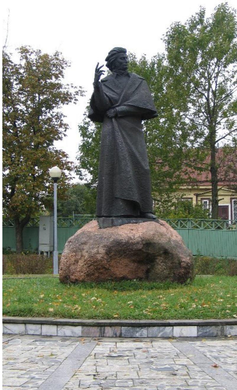
Pomnik A. Mickiewicza w Nowogródku