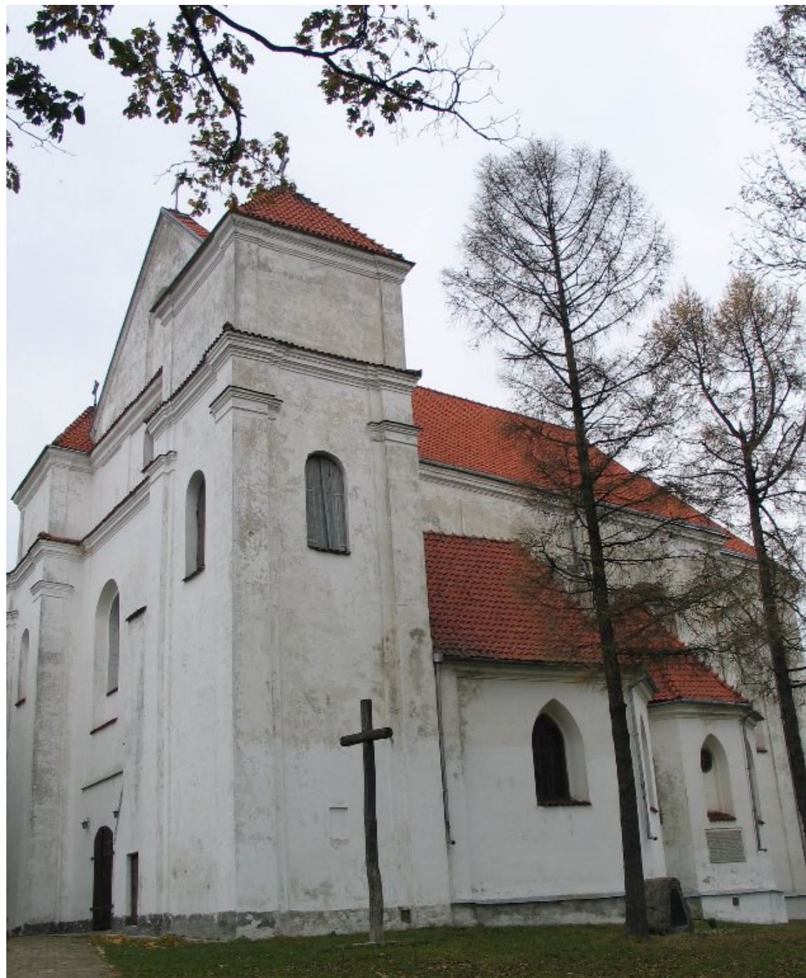
Kościół, w którym był chrzczony A. Mickiewicz